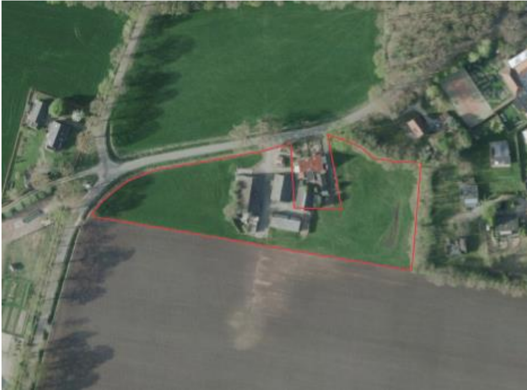
Afbeelding 1. Ligging plangebiedb.