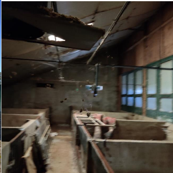
Afbeelding 3. Impressie plangebied, situatie op 30 oktober 2019.