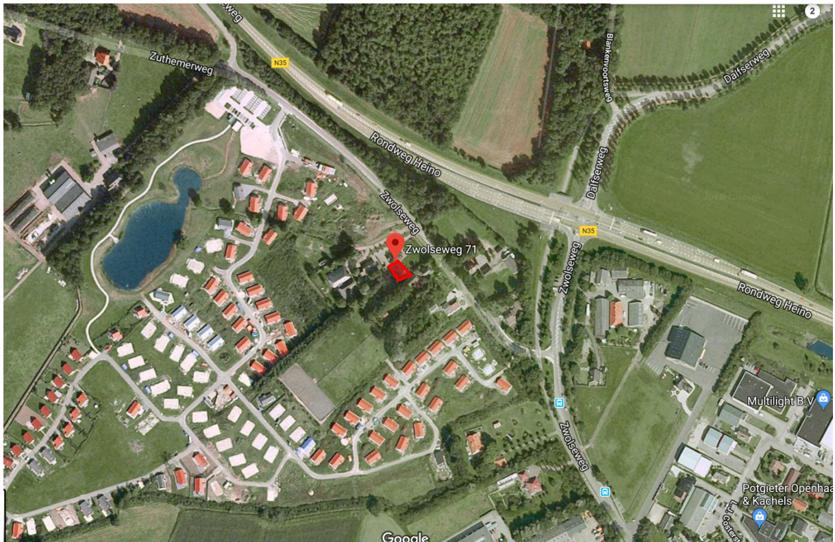
Afb. 3.1. Locatie plangebied (rood)

In de directe omgeving van het onderzoeksgebied staan enkele diverse vrijstaande woningen en het park Old Heino met recreatiewoningen. De omgeving bestaat verder uit agrarisch grasland met enkele bomenrijen en houtopstanden. De invloeden van het dorp zijn vanuit het perceel te verwaarlozen.