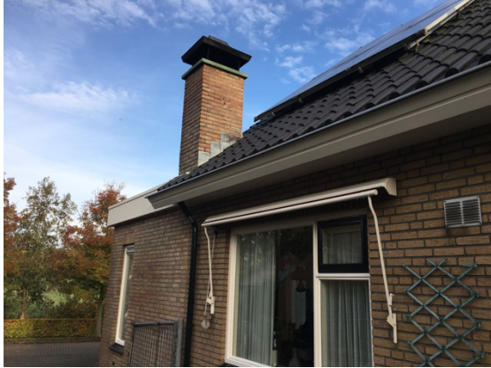
Afb. 3.2. Achterzijde te amoveren woning