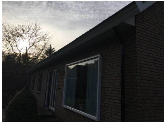
Afb. 3.5. Voorgevel woning