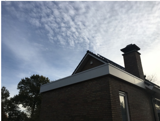
Afb. 3.4. Voor- en zijgevel woning