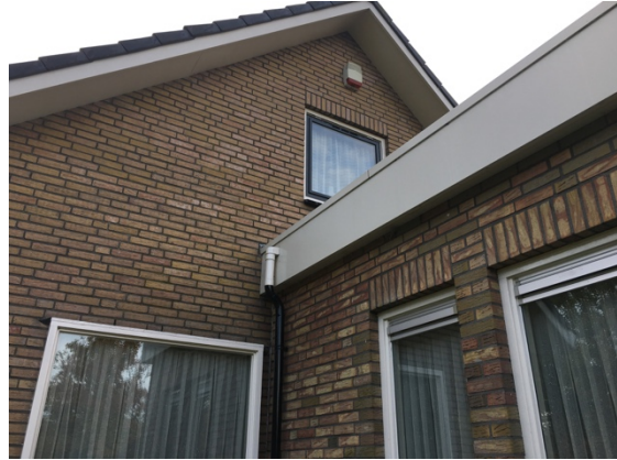
Afb. 3.3. Voor- en zijgevel woning