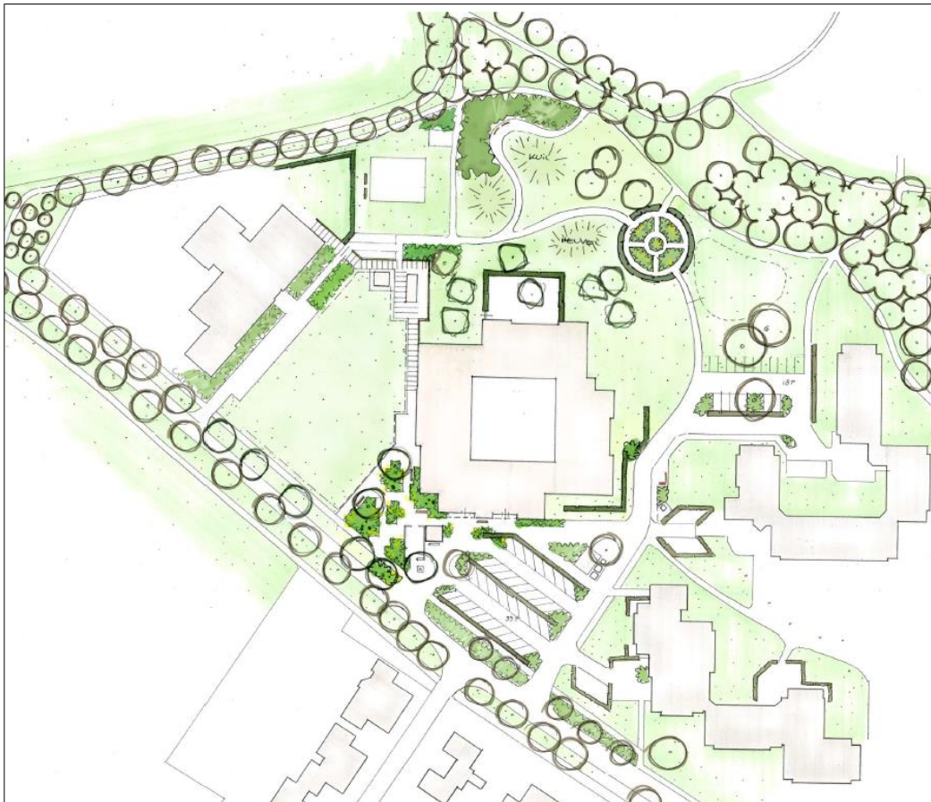
Figuur 2: nieuwe situatie met middenin het nieuwe Stevenskamp.