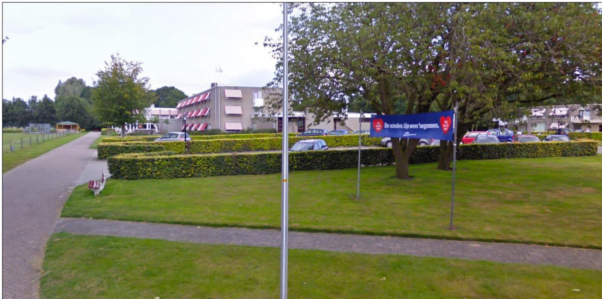
Afbeelding 1: De Stevenskamp vanaf de Weseperweg

Ook wordt voorgesteld om de verbeelding iets aan te passen ten behoeve van de geplande verbinding tussen Stevenserf en het nieuwe Stevenskamp.