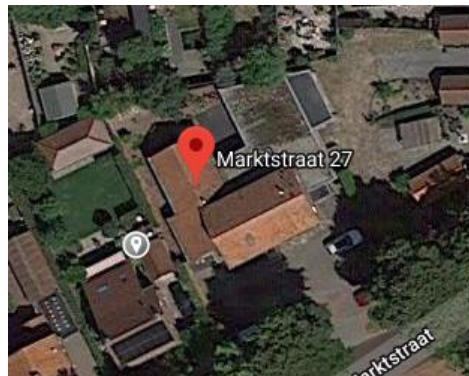
Luchtfoto huidige situatie

Het perceel aan de Marktstraat 27-29 verandert van bestemming: van maatschappelijk naar een woonbestemming. Daarvoor moet het bestemmingsplan gewijzigd. Archeologisch onderzoek is onderdeel van de wijzigingsprocedure.