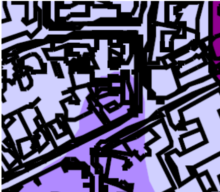
Uitsnede gemeentelijke archeologische beleidskaart