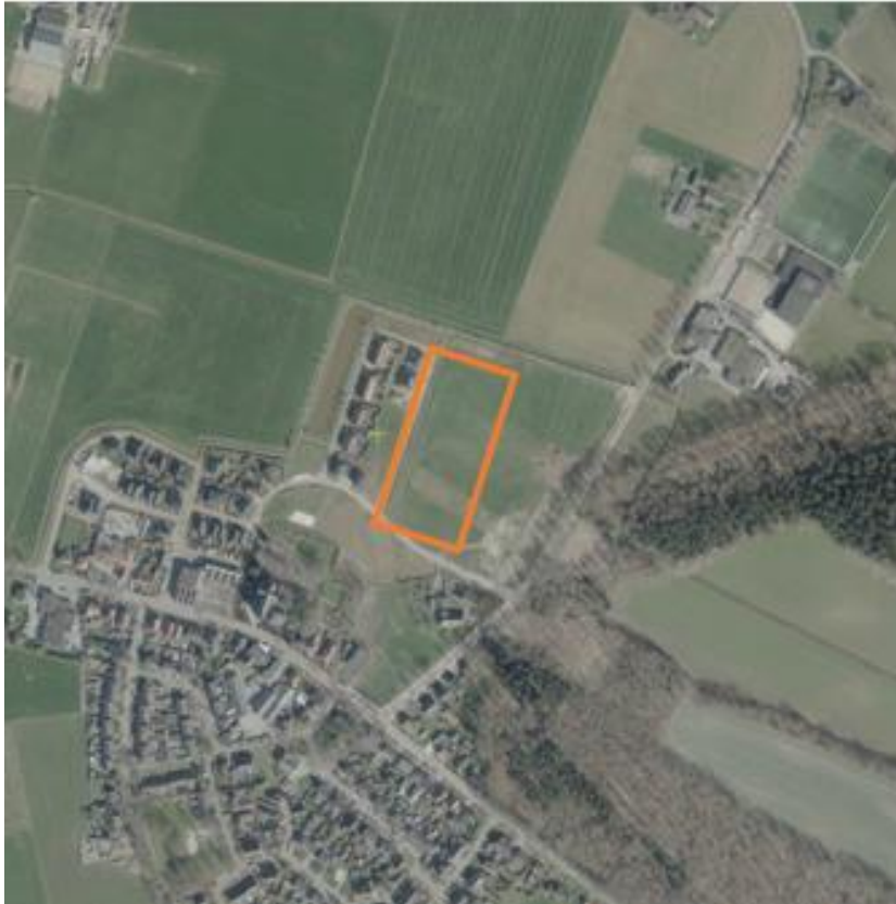
Figuur 2 Luchtfoto met de ligging van het plangebied (oranje kader).

De bouwlocatie betreft een agrarisch grasland dat aan de westzijde begrensd wordt door bestaande woningen en aan de oostzijde op korte afstand door een bosgebiedje. Oostelijk binnen het plangebied ligt een (bijna volledig droogstaande) sloot. Langs deze sloot staan een paar jonge bomen. De omgeving bestaat verder vooral uit agrarisch land, met langs de wegen wegbepanting (Figuur 2). Figuur 3 bevat een foto impressie van het plangebied.