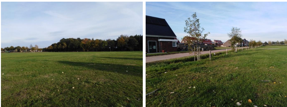
Figuur 3 Foto impressie van het plangebied.