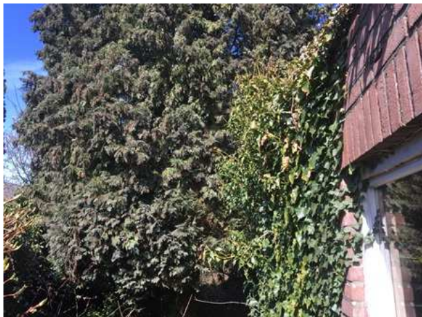
Klimop aan de muur van de bedrijfshal; geschikte broedplaats voor verschillende vogelsoorten.

Te beoordelen activiteit in het kader van de Wnb: