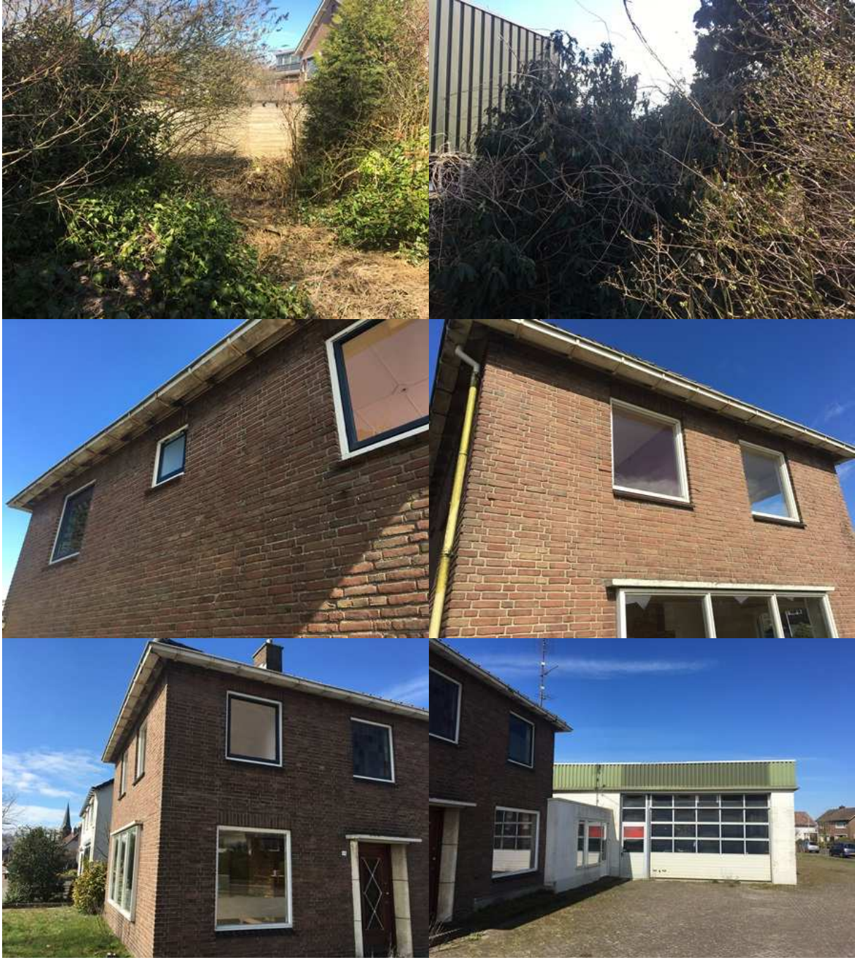
Bijlage 3. Fotobijlage. Impressie van het plangebied en de directe omgeving.