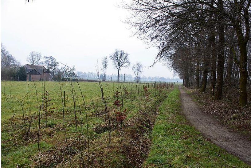
Aangeplante zone, gezien van de noordzijde richting de Schöpkesdijk