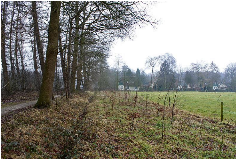
Aangeplante zone, gezien van de Schöpkesdijk richting het noorden.