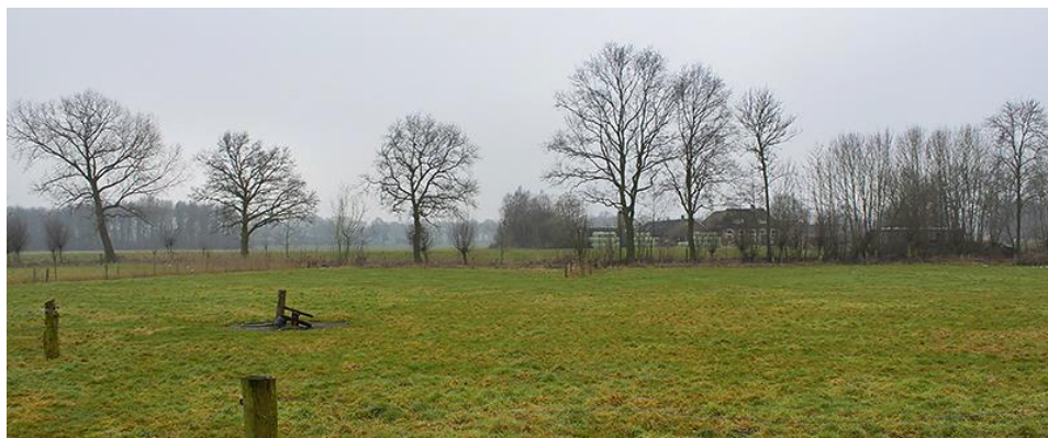
Zicht in zuidoostelijke richting