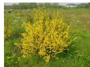
Bremstruweel Sarthamnus scoparius Wilde brem Te beplanten oppervlakte 400 m 2 Plantafstand 100x100 cm

Struweelbeplanting: typologie bremstruweel langs de bosranden Nieuwe aanplant met natuurlijke ontwikkeling Aanplant van: 20% Sarthamnus scoparius Wilde Brem 20% Prunus spinosa Sleedoorn 20% Amelanchier lamarckii Krent 20% Rosa rubiginosa Egelantier 20% Rosa canina Hondсроos Plantafstand 150x150 cm Randbreedte: 4 m Te beplanten randlengte 160 m1 Te beplanten oppervlakte 640 m 2