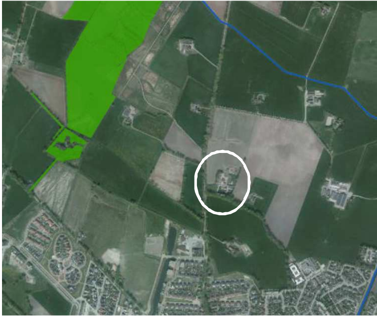
Ligging van de EHS-gronden (groene arcering) rondom het onderzoeksgebied (cirkel).