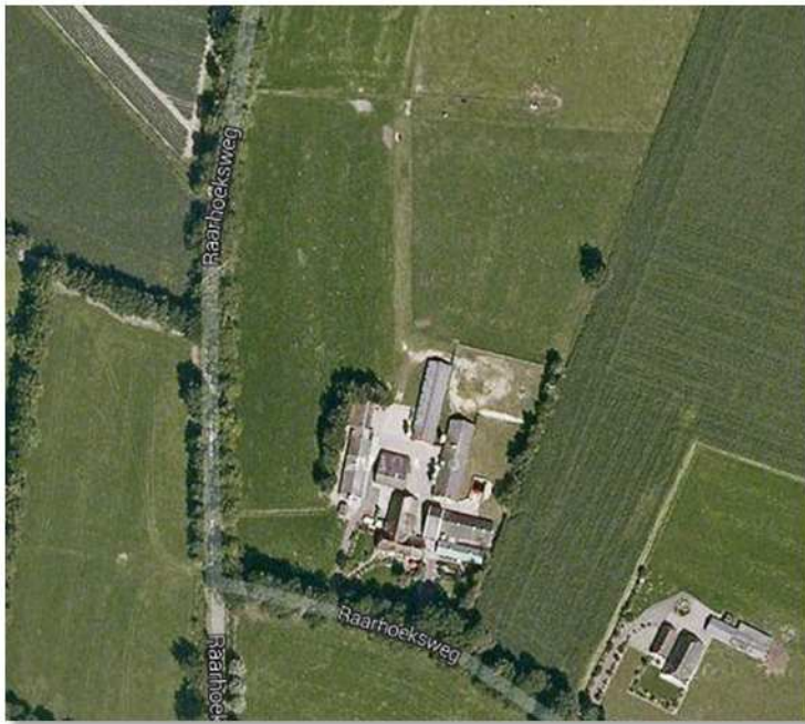
Detailopname van het onderzoeksgebied.