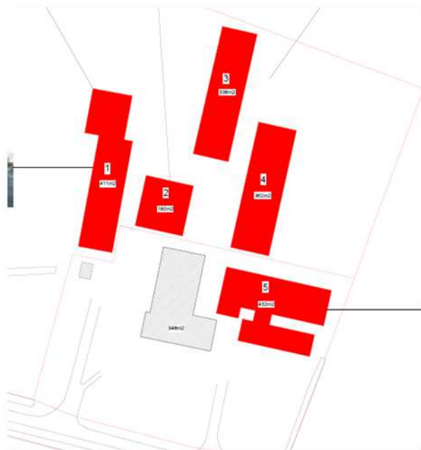
Overzicht van te slopen gebouwen (rood) en te behouden gebouwen (grijs)

Er zijn concrete plannen om alle schuren op het erf te slopen en twee vrijstaande woningen in het plangebied te bouwen. De nieuwe woningen worden landschappelijk ingepast door de aanleg van erfbeplanting en landschappelijke beplanting. Op onderstaande afbeelding worden de te slopen stallen weergegeven. Op de afbeelding eronder, wordt de nieuwe erfopzet weergegeven.