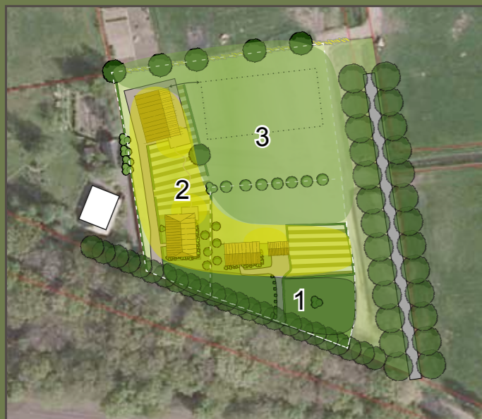
Verschillende karakteristieken op het erf

Het erf is ingedeeld in drie delen, een openbare formele voorkant, een privé informele binnenkant en een semiprivé achterkant. Voor elk deel zijn elemen- ten benoemd die kunnen worden toegepast om het erf in te richten. De scheiding tussen de delen is niet zo strikt maar vormt een richtlijn voor de inrichting.