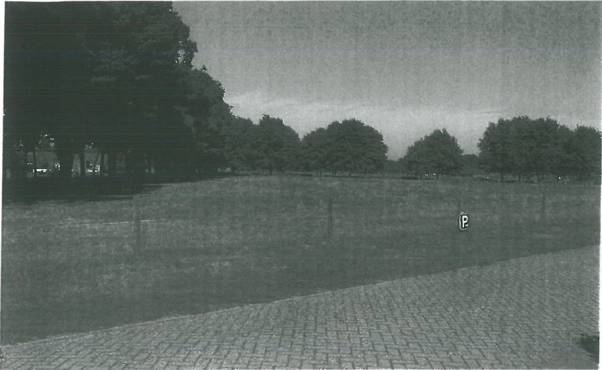
Uitzicht over de locatie van de toekomstige Woonzorgboerderij Heeten

Als bijlage bij: andere zienswijze Woonzorgboerderij Heeten 10 september 2013