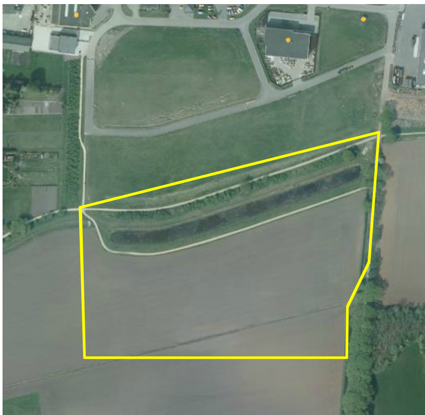
Detailopname van het plangebied. Het plangebied wordt met de gele lijn aangeduid.