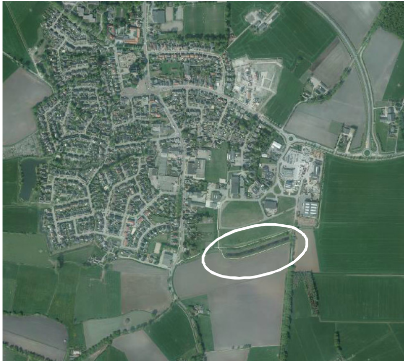
Situering van het plangebied en de omgeving. Het plangebied wordt met de cirkel aangeduid.

Het plangebied is gesitueerd net ten zuiden van bedrijventerrein De Telgen II, net ten zuidoosten van de woonkern Heeten. Het ligt in het buitengebied. Op onderstaande afbeelding wordt de ligging van het plangebied weergegeven.