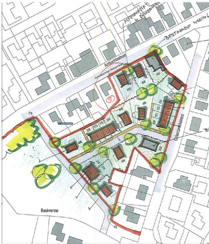
Schets van de mogelijke nieuwe situatie na sloop van de slachterij en nieuwbouw van woningen.