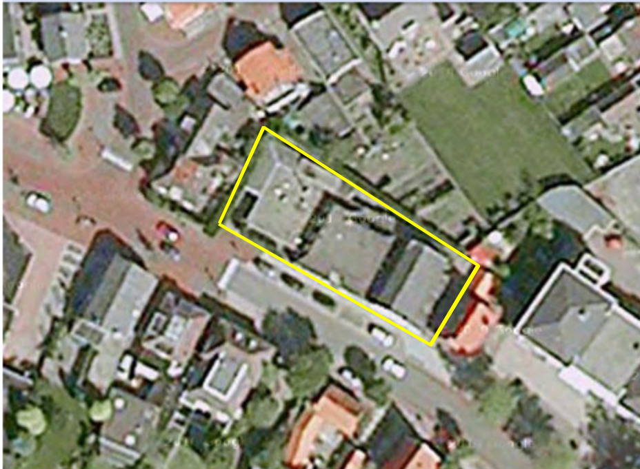
Afbeelding 1. Detailopname van het studiegebied. Het studiegebied wordt met de gele contour aangeduid.

Het studiegebied ligt aan de Canadastraat 31 in Heino, gemeente Raalte (Ov.). Het ligt in de dorpskern van Heino. Amersfoortcoördinaten 212.5-494.6. Atlasblok 27-27-13.