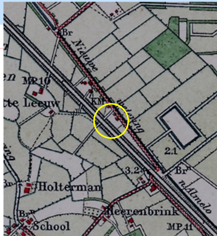
Topografische kaart rond 1920