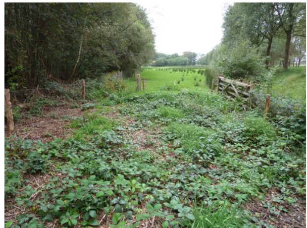
open hek in raster