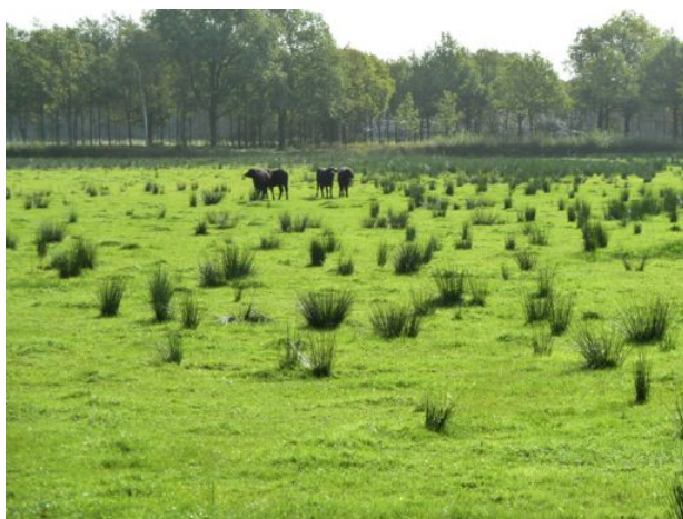
waterbuffels op Den Alerdinck II

De landbouwgronden ten zuiden van het landgoed en ten oosten van de N35 zijn veel intensiever in gebruik als cultuurgrasland of snijmaïsakker. Het voedselaanbod hiervan is geringer en minder gevarieerd.