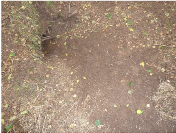
vers vergraven pijp op hoofdburcht

Op ca. 300 m ten zuiden van de planlocatie ligt in een bosperceel met eikenhakhout een grote familieburcht (8x20 m 2 ) met 16 pijpen, waarvan 3 zeer recent vergraven (< 2 dagen oud). Er zijn verder geen (bij)burchten of vluchtpijpen in het onderzoeksgebied gevonden.