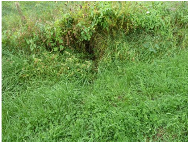
ingang dassentunnel oostzijde N35; overgroeid raster

Beide hekken in het raster stonden open, waarvan de meest noordelijke (tussen N35 en houtwal) ook niet meer dicht kan, omdat er een raster is voorgezet.