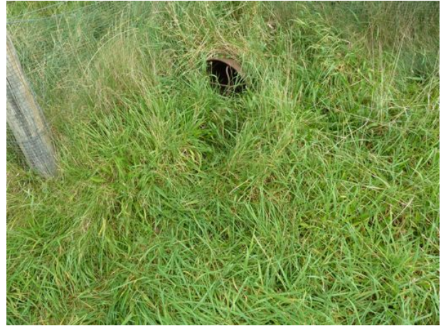
ingang dassentunnel westzijde N35