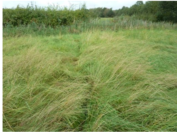
wissel achter woning op Zwolseweg 83