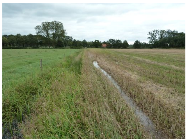
gras en graan rond de bouwlocatie