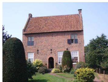
Spijker te Vierakker

De oudste vermelding van de Solenspijker stamt uit 16 e en 17 e eeuwse bronnen. Het betreft dan het gebruik van de spijker, in het bezit van de familie Sweersen, als katholiek bedehuis. De katholieke gelovigen in en rond om Heino waren van 1581 tot 1685 voor hun geloofsbeleving aangewezen op afgelegen plekken buiten stad of dorp.