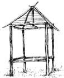
Spijker uit de ijzertijd (800 v. Chr. – 50 v. Chr.)

archeologische verwachting. Het betreft de mogelijke locatie van de Solenspijker. Een spijker, of spijker, is een graanopslagplaats. Het woord spijker komt van het latijnse spicarium = korenschuur. De graanopslagplaats is in de loop der eeuwen veranderd van een simpele houten constructie via een stenen herenkamer aan een schuur naar een stenen huis.