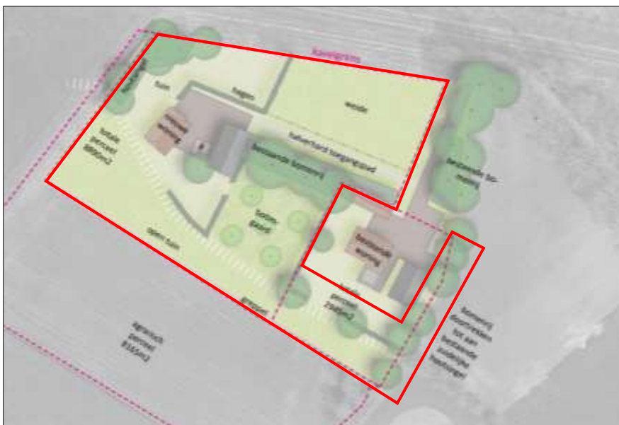
Plattegrond van erf na planrealisatie; begrenzing van het plangebied wordt met de rode lijnen aangeduid

Het voornemen bestaat om beide varkensstallen te slopen en vervangende nieuwbouw van een woning te realiseren. De woning wordt in het westelijke deel van het plangebied gebouwd en wordt deels gebouwd op agrarisch cultuurland. Ten oosten van de woning wordt een parkpeerplaats aangelegd. Aangenomen wordt dat een deel van de erfverharding verwijderd en vervangen wordt en dat er nieuwe erfverharding wordt aangelegd. Tevens wordt aangenomen wordt dat de beplanting in het plangebied wordt ingepast in het nieuwe ontwerp en niet wordt verwijderd. Het nieuwe erf wordt nadien landschappelijk ingepast door middel van de aanplant van erfbeplanting van enkele solitaire loofbomen en hagen. In de noordwesthoek van het plangebied wordt een houtsingel aangelegd en in de zuidoosthoek wordt een nieuwe bomenrij van solitaire loofbomen geplant. Er wordt ook een boomgaard geplant centraal gelegen in het plangebied. In het noordoostelijke deel van het plangebied wordt intensief beheerd agrarisch cultuurland omgezet naar weide en langs de binnenzijde van de zuidelijke grens van het plangebied komt een tuin en een greppel. Op onderstaande afbeelding wordt een plattegrond van het wenselijk eindbeeld weergegeven.