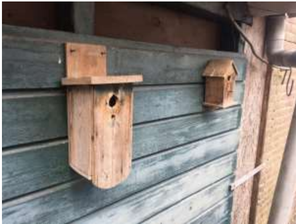
Deze nestkasten kunnen potentiële verblijfplaatsen bieden voor koolmees en pimpelmees.

Het plangebied behoort tot functioneel leefgebied van verschillende vogelsoorten. Vogels benutten het plangebied als foerageergebied en vermoedelijk nestelen er jaarlijks vogels in het plangebied. Vogels kunnen een nestlocatie bezetten in de beplanting en in de nestkasten aan de buitengevels van de te slopen varkensstallen. De bebouwing beschikt niet over invliegopeningen en is daardoor ontoegankelijk voor vogels om naar binnen te vliegen. Vogelsoorten die mogelijk in het plangebied nestelen zijn merel, vink, roodborst, winterkoning, houtduif, koolmees en pimpelmees. Het intensief beheerd agrarisch cultuurland wordt uitsluitend gebruikt door vogels die foerageren in het open, agrarisch cultuurland. Het intensief beheerd agrarisch cultuurland vormt geen nestplaats voor (weide)vogels. In het plangebied zijn geen aanwijzingen gevonden dat huismussen, huiszwaluwen of boerenzwaluwen er een rust- of voortplantingsplaats bezetten. Tevens zijn geen aanwijzingen gevonden dat steen- of kerkuil er een vaste rust- of nestplaats bezetten. Er zijn ook geen aanwijzingen dat roofvogels een vaste rust- of nestplaats in het plangebied bezetten.