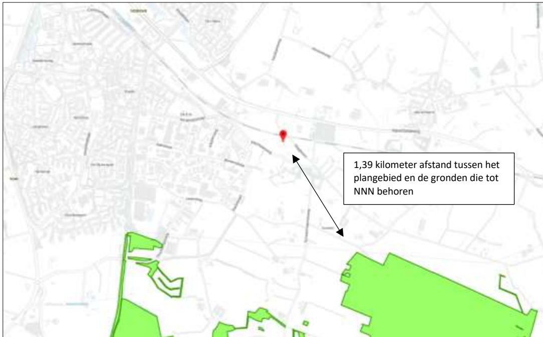
Ligging van Natuurnetwerk Nederland in de omgeving van het plangebied. De ligging van het plangebied wordt met het rode marker aangeduid. Gronden die tot Natuurnetwerk Nederland behoren worden met de lichtgroene kleur op de kaart aangeduid.