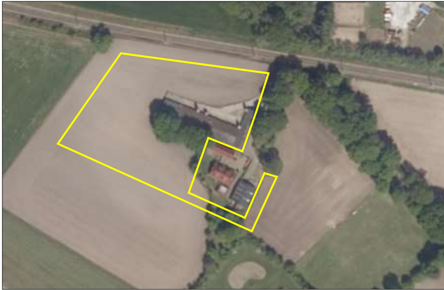
Begrenzing van het plangebied; deze wordt met de gele lijnen aangeduid (bron luchtfoto: ruimtelijkeplannen.nl).