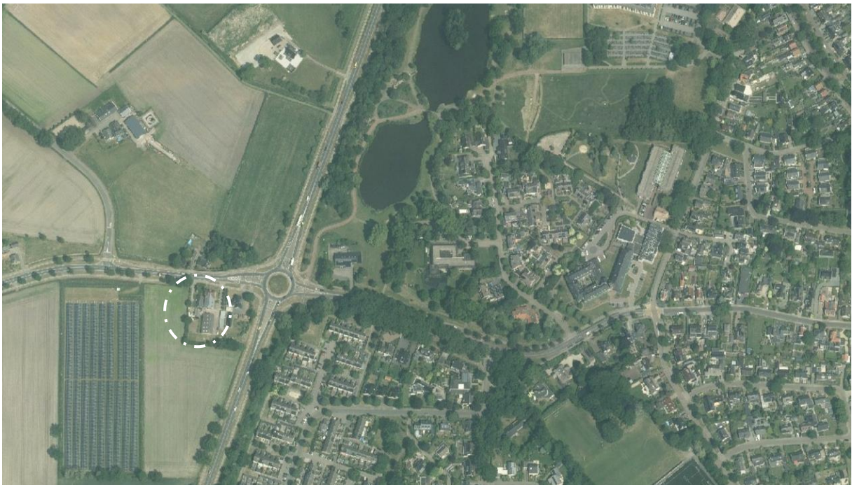
Figuur 1: Ligging van de Wijheseweg 3 en 5 (witte onderbroken cirkel) net buiten de kern Raalte

Het projectgebied betreft het perceel aan de Wijheseweg 3 en naastgelegen woning aan de Wijheseweg 5 in Raalte. De locatie is gelegen net buiten het dorp Raalte en ligt daarmee in het overgangsgedebied van het dorp naar het landelijk gebied. Ten westen van het projectgebied ligt de rotonde waar de Wijheseweg en de Nieuwe Deventerweg elkaar kruisen. Daarachter is het dorp Raalte gelegen. Ten oosten en zuiden wordt het projectgebied begrensd door agrarische gronden. Aan de noordzijde ligt de Wijheseweg.