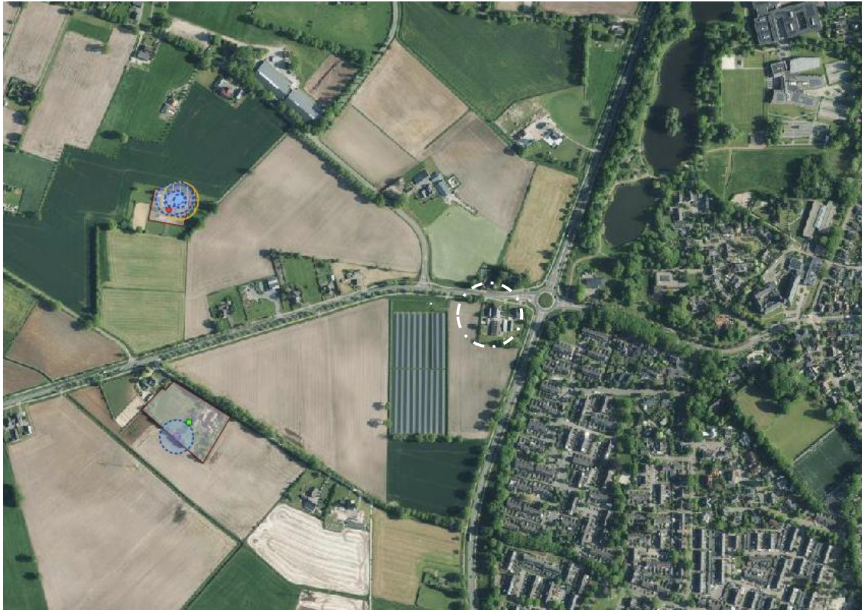
Figuur 8: Ligging van het plangebied (wit omcirkeld) ten opzichte van de dichtstbijzijnde externe risicobronnen