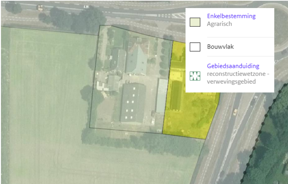
Figuur 3: Uitsnede voormalig bestemmingsplan 'buitengebied Raalte', inmiddels opgegaan in tijdelijk Omgevingsplan gemeente Raalte