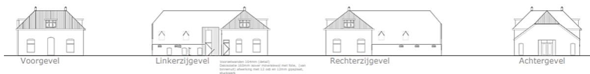
Figuur 4: Schets toekomstige situatie met verbouwde schuur (achterste deel van het gebouw) tot woning

De Wijheseweg 5 wordt in de huidige situatie al bewoond door derden en is reeds kadastraal gesplitst van de woning aan de Wijheseweg 3. De woning aan de Wijheseweg 3 zal bewoond worden door de initiatiefnemers.