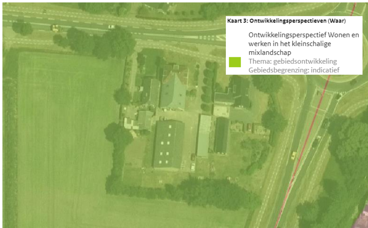
Figuur 7: Ligging van het plangebied in ontwikkelingsperspectief 'Wonen en werken in het kleinschalige mixlandschap'

Aan het plangebied is het ontwikkelingsperspectief 'Wonen en werken in het kleinschalige mixlandschap' toegekend. Het ontwikkelingsperspectief 'Wonen en werken in het kleinschalige mixlandschap' is gericht op het in harmonie met elkaar ontwikkelen van de diverse functies in het buitengebied. Aan de ene kant melkveehouderij, akkerbouw en opwekking van hernieuwbare energie als belangrijke vormen van landgebruik. Aan de andere kant moet er ruimte zijn voor natuur, recreatie, wonen en andere bedrijvigheid. Het plan past daarmee binnen het geldende ontwikkelingsperspectief.