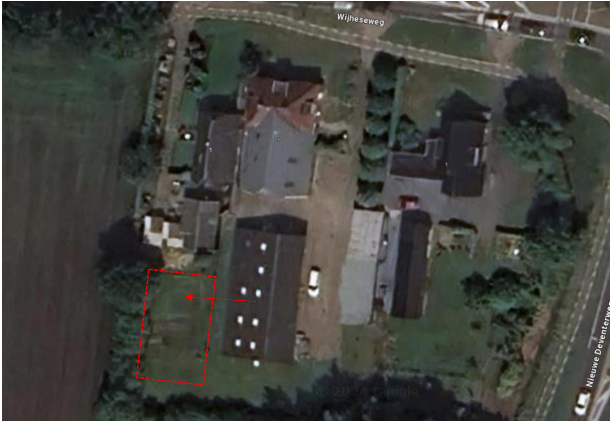
Figuur 5: Gewenste locatie te verplaatsen schuur