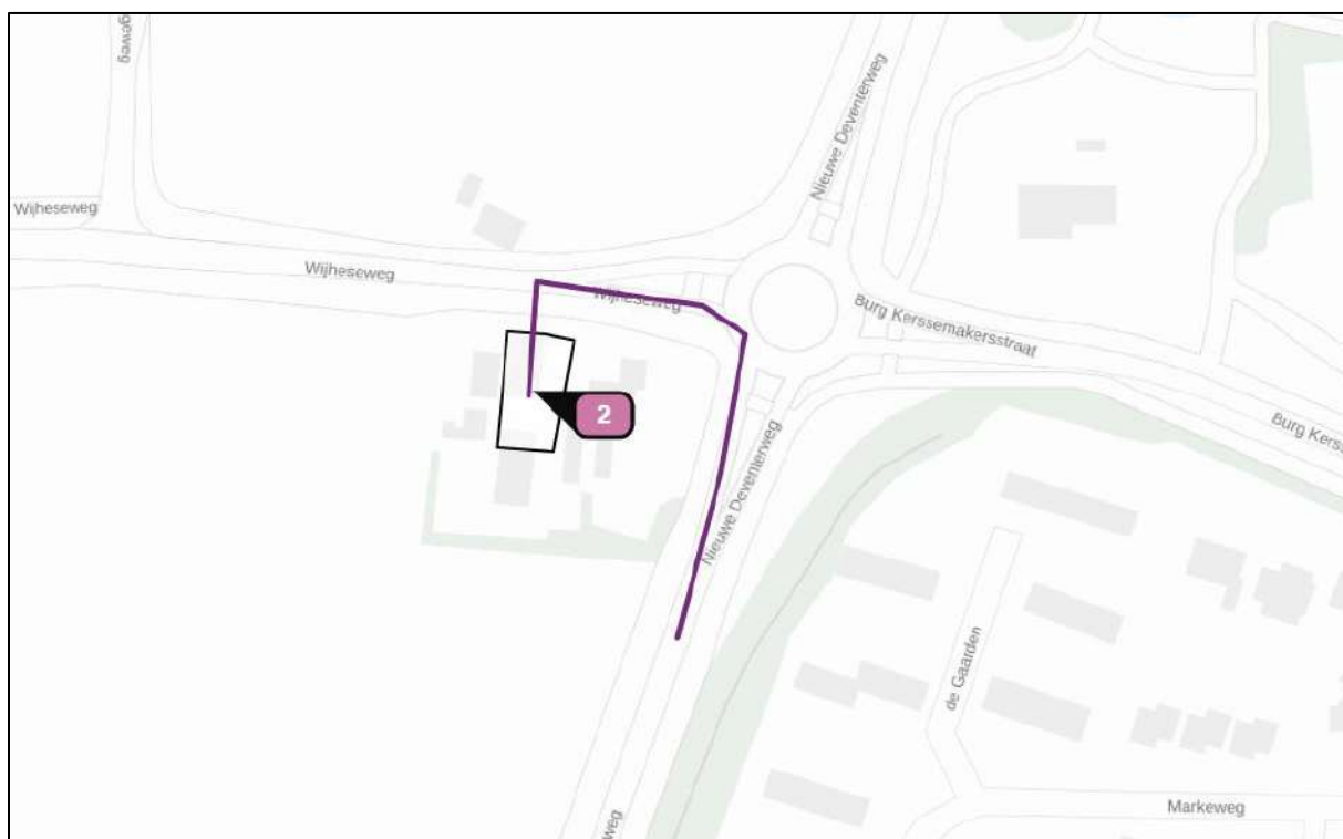
Afbeelding 3. Route van en naar het projectgebied aan de Wijheseweg 3 te Raalte.

Voor de verkeersbewegingen in de gebruiksfase dient tevens rekening te worden gehouden met de plaats waar de verkeersbewegingen opgaan in het heersende verkeersbeeld. Hiervoor is – net als in de aanlegfase – de Nieuwe Deventerweg aangehouden.