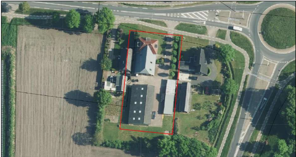
Afbeelding 1. Het erf aan de Wijheseweg 3.

Ten behoeve van de aanvraag omgevingsvergunning verlangt het bevoegd gezag een analyse waarmee aangetoond wordt of er significante depositie van stikstof op aangewezen habitattypen een leefgebieden plaatsvindt. Voorliggende rapportage betreft een analyse doormiddel van een stikstofberekening om aan te tonen dat de stikstofdepositie, welke veroorzaakt wordt door de werkzaamheden ten behoeve van de splitsing van de woning, geen significant negatieve effecten heeft op Natura 2000-gebieden.