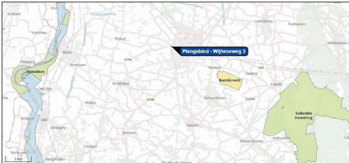
Afbeelding 2. Ligging plangebied in relatie tot Natura 2000-gebieden.