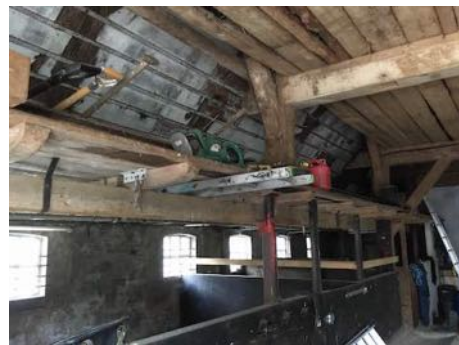
Figuur 5. Te verbouwen westzijde van de deel.