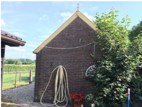
Figuur 6. Bakhuis.