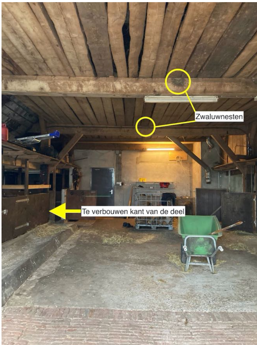
Figuur 9. De deel vanuit de ingang gezien met locaties zwaluwnesten en te verbouwen gedeelte.

In de deel waren nesten van boerenzwaluw aanwezig. Het ging om twee nesten tegen de liggers van de zolder in het midden van de deel. Dit gedeelte van de deel blijft intact en het gebruik ongewijzigd. Er is daarom geen effect op de geschiktheid van de deel als broedplaats voor boerenzwaluw wat betreft toegankelijkheid of nestgelegenheid. Wanneer de verbouwing in het broedseizoen plaatsvindt zou verstoring van broedsels op kunnen treden door de bouwactiviteiten. Wanneer op de plaats van de verbouwing nesten aanwezig zijn kan sterfte optreden.