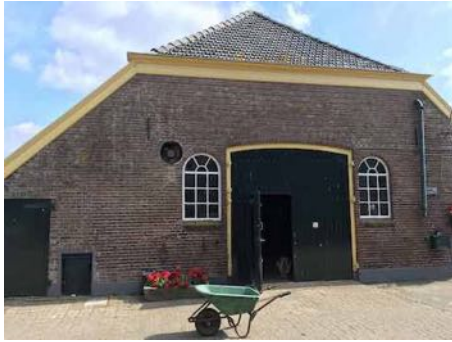
Figuur 2. Voorgevel van de deel.