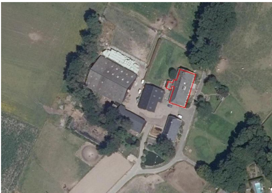
Figuur 1. Erf aan de Liederholthuiserweg 42 met plangebied in rood.

Het voornemen bestaat om de westzijde van de deel geschikt te maken voor bewoning. In dit verband worden vensters in de gevel vervangen en wanden geplaatst. Het beschot en de pannen blijven ongemoeid.