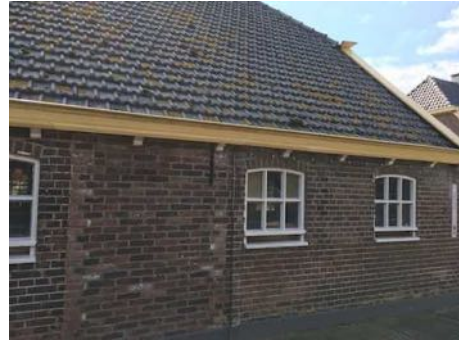
Figuur 3. Zijgevel van de deel.