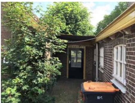
Figuur 4. Aansluiting van deel (r) met bakhuis (l).