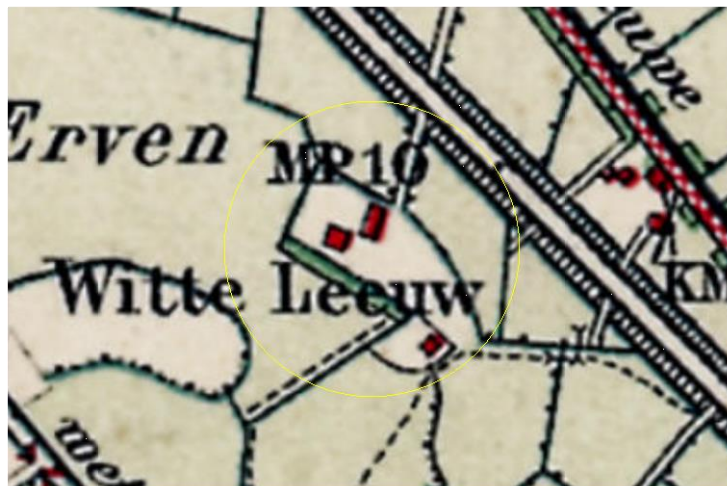
Uitsnede topografische kaart rond 1920

Het erf aan de Lierderholthuisweg is van cultuurhistorische waarde. Het erf en de eerste bebouwing zijn ontstaan rond 1920. De bebouwing, de boerderij en de schuur, zijn nog zeer gaaf te noemen. Vroeger werd het erf ontsloten via de Bredenhorstweg. Door het sluiten van de spoorwegovergang is deze komen te vervallen. Het erf wordt nu ontsloten via de Lierderholthuisweg. Het oude tracé vanaf het spoor naar het erf is nog aanwezig alsmede de laanbeplanting van deze oude route. Door het laantje wordt het erf fraai verbonden met het omringende landschap. Aan de oost- en zuidzijde van het erf staan houtsingels, hierdoor is het erf landschappelijk goed ingepast.