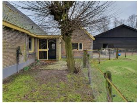
Bakhuis met knotlinde

Aan de oostzijde van het erf, bij het bakhuis, staat een oude knotlinde, deze moet behouden blijven.