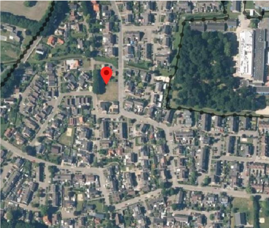
Afbeelding 1 Ligging locatie Woolthuisweg 1-3 Heino

zijn inmiddels gesplitst. Kadastraal is het perceel waar de initiatiefnemer voornemens is de woning toe te voegen bekend als Heino, C 4595.