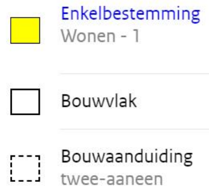
Afbeelding 2 Uitsnede bestemmingsplan Heino

Vanuit stedenbouwkundig opzicht heeft deze locatie de voorkeur. De woning is zodoende gesitueerd dat de omwonenden zo min mogelijk nadelige effecten ervaren. Daarnaast wordt de woning ingepast met bestaande landschapselementen en door het toevoegen van groenelementen. Een uitrit aan de zijde van de Woolthuisweg is niet gewenst ten aanzien van de verkeersveiligheid.