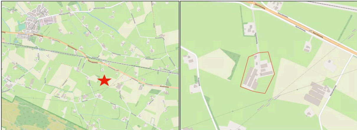
Afbeelding 1.1 Ligging plangebied (Bron: PDOK)

In afbeelding 1.1 is de ligging van het plangebied ten opzichte van Mariënheem (rode ster) en de directe omgeving (rode omkadering) weergegeven.