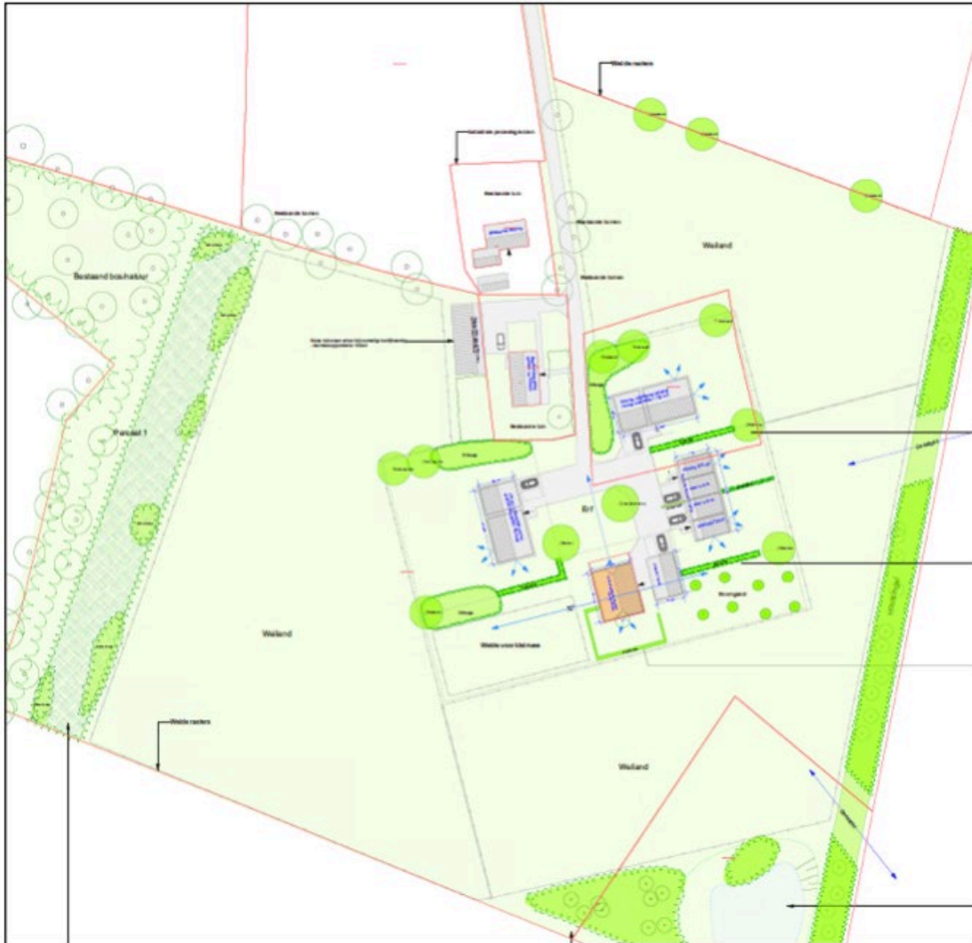
Afbeelding 3.2 Impressie gewenste situatie