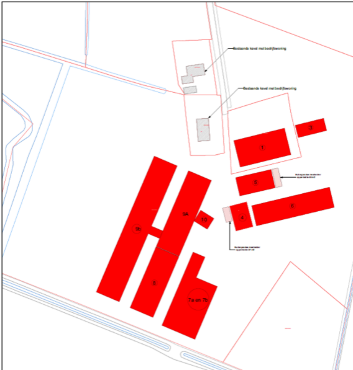
Afbeelding 3.1 De te slopen bebouwing

In afbeelding 3.1 is de te slopen bebouwing in het rood weergegeven. In afbeelding 3.2 is een impressie van de gewenste situatie weergegeven.