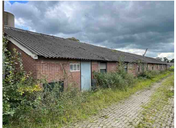
Figuur 9. Gebouw 8.