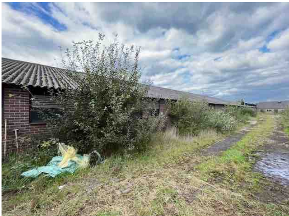
Figuur 10. Gebouw 9.