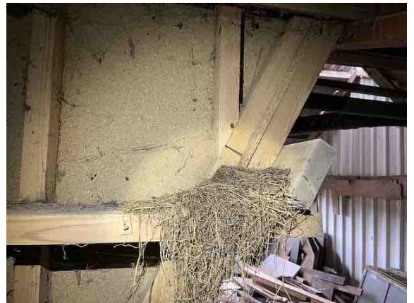
Figuur 13 - 14. Gebouw 3 met boerenzwaluwnest (l) en mogelijk huismussennest.