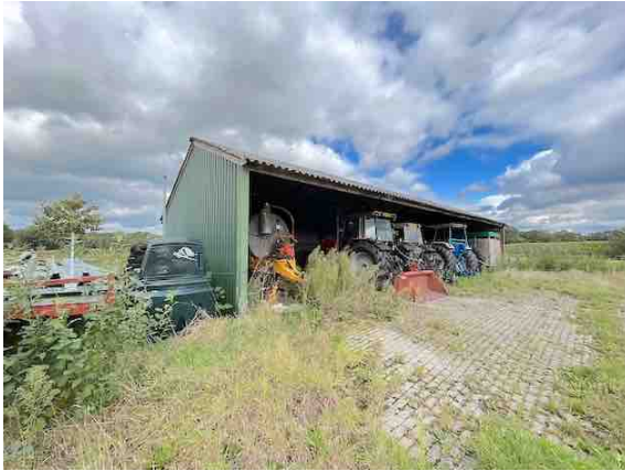
Figuur 3. Gebouw 1.