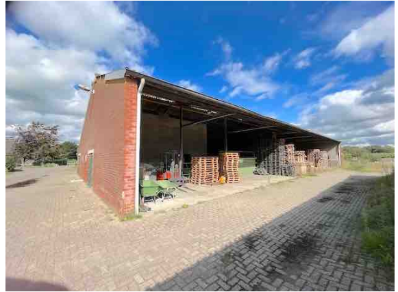
Figuur 4. Gebouw 2.