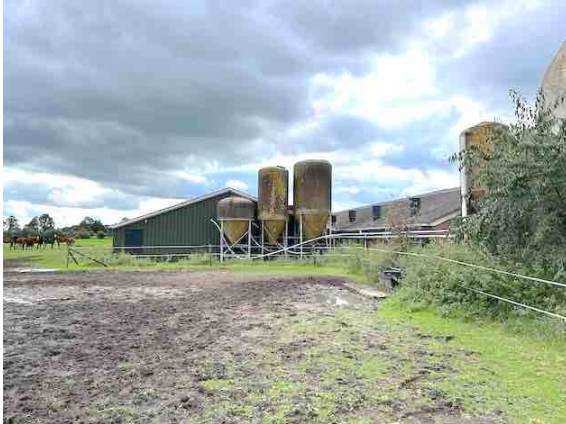
Figuur 9. Gebouw 7.