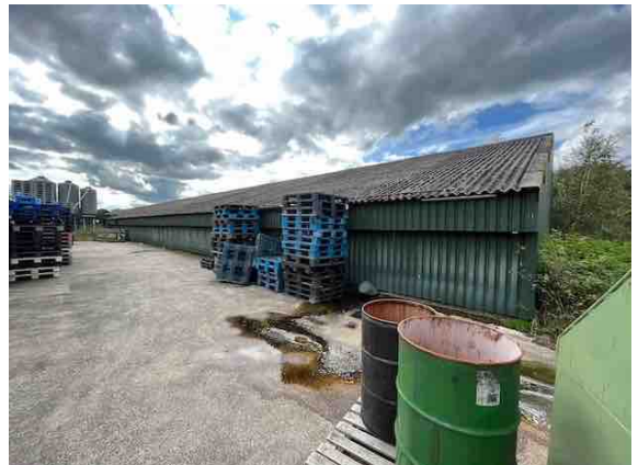
Figuur 11. Gebouw 10.