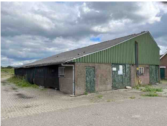
Figuur 5. Gebouw 3.