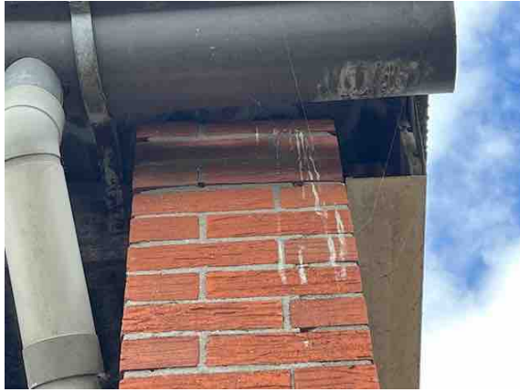
Figuur 11. ZO-hoek gebouw 2 met mogelijke mestsporen van kerkuil.