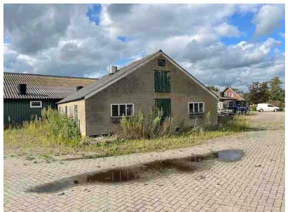
Figuur 8. Gebouw 6.