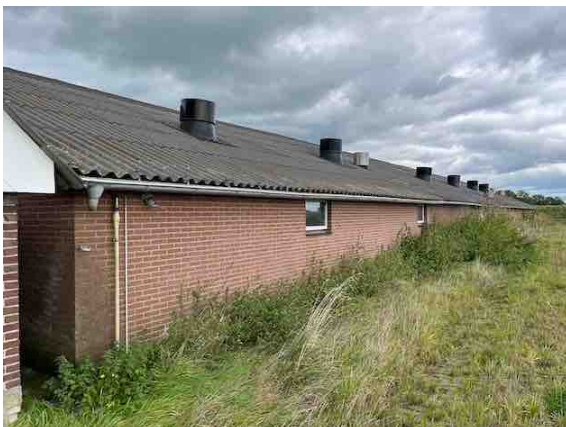
Figuur 7. Gebouw 5.