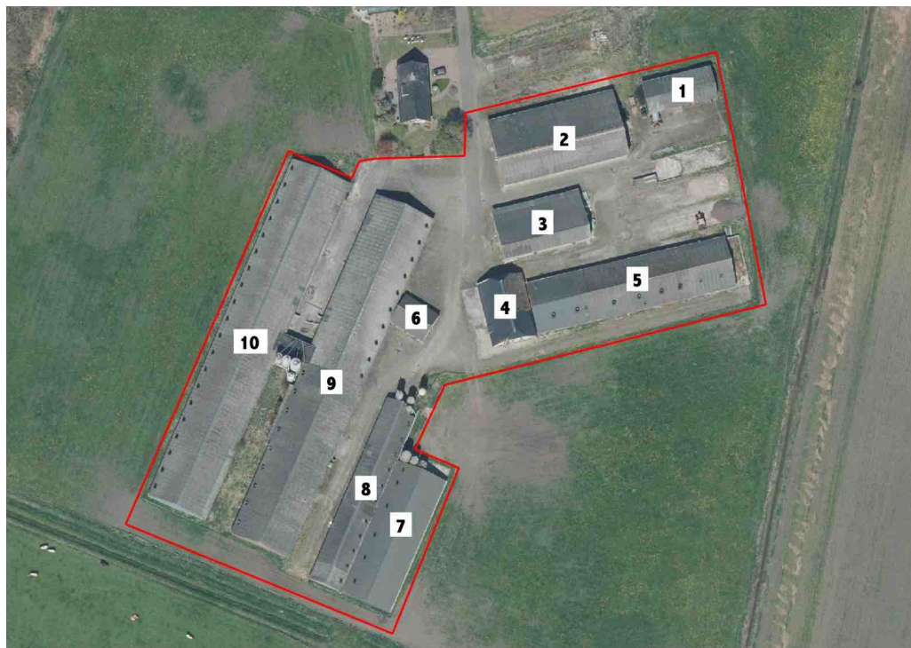
Figuur 2. Recente luchtfoto erf (rood) met de genummerde gebouwen.

Een kapschuur van profielplaat met een golfplaten dak. De gehele constructie is enkelwandig.