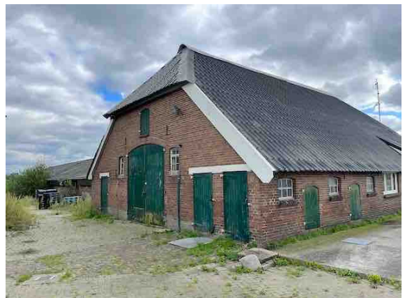
Figuur 6. Gebouw 4.