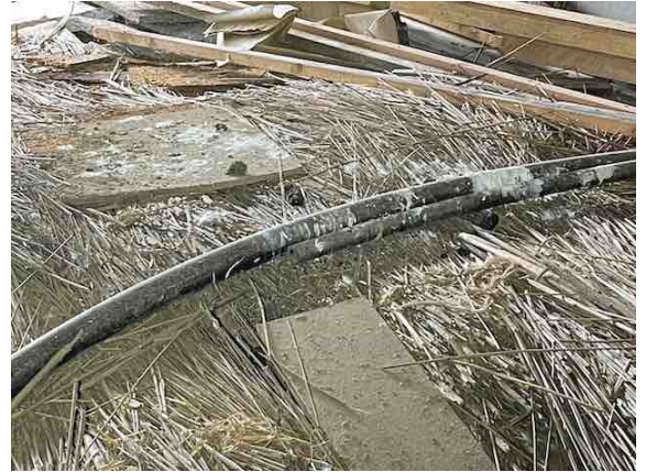
Figuur 12. Braakballen en mestsporen van kerkuil op de zolder van gebouw 3.