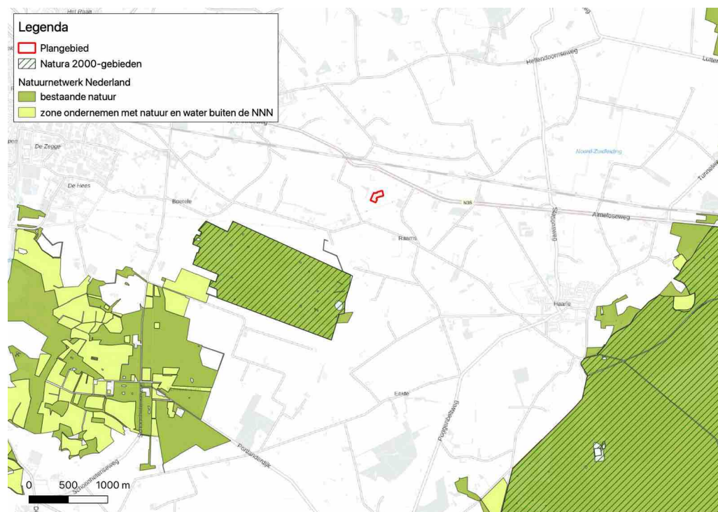
Figuur 10. Ligging plangebied t.o.v. beschermde natuurgebieden.

Het plangebied maakt geen deel uit van beschermde gebieden. Buiten de bebouwde kom liggen onderdelen van het Gelders natuurnetwerk en Natura 2000-gebied Boetelerveld en Sallandse Heuvelrug. De afstand van het plangebied tot de beschermde gebieden bedraagt minimaal circa een kilometer.