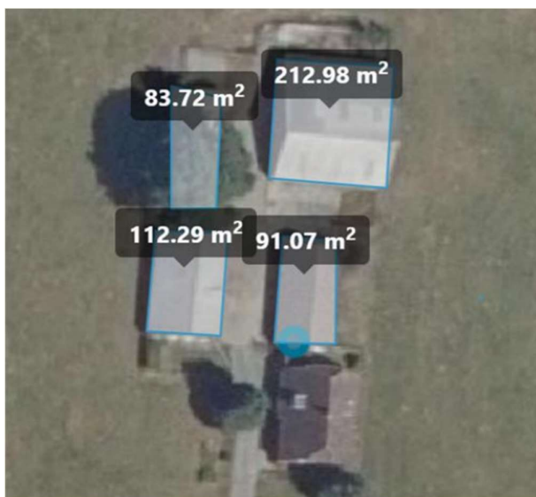
Figuur 1 sloopmeters Lemelerveldseweg 5, Heino

Van het totale slooppoppervlak van de Lemelerveldseweg is 352m 2 aan sloopmeters inzetbaar. Niet alle meters zijn inzetbaar omdat de bijgebouwen welke je bij recht weer terug mag bouwen van het oppervlak moet afhalen. In dit geval is dit (150-92) =58m 2 . Met de aangekochte meters van de Nielandsweg 5 (570m 2 ) (figuur 2) kom je op een totaal van 922m 2 . Dit oppervlak is voldoende om een compensatiekavel op het erf aan de Lemelerveldseweg 5 te realiseren.