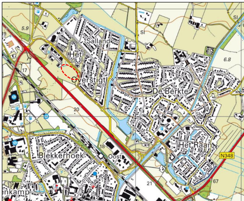
Ruimtelijke situatie in en rondom het plangebied (globaal rood omcirkeld).

Het plangebied maakt onderdeel uit van Raalte Noord en ligt ten noorden van de N35. Halverwege de jaren '50 is de N-weg aangelegd. Vanaf 1990 begint Raalte met de uitbreiding aan de noordzijde van de N-weg. Eerst dichtbij het centrum rondom het kanaal, later ook verder richting het westen. De plannen voor kantorenlocatie Sallandse Poort zijn onderdeel van de stedenbouwkundige plannen voor de wijk Het Overstigt en zijn begin deze eeuw opgesteld. Nu bijna 20 jaar later is een groot gedeelte van deze wijk gerealiseerd met uitzondering van de laatste kantorenlocatie. De kantorenlocatie bevindt zich aan de Burgemeester Zuidwijkstraan en is verspreid over drie zogenoemde lobben. De twee ingevulde lobben zijn nu voornamelijk in gebruik in de vorm van enkele kleinschalige kantoor- en zorgfuncties. Verder vormt wonen de overheersende functie in Raalte Noord.