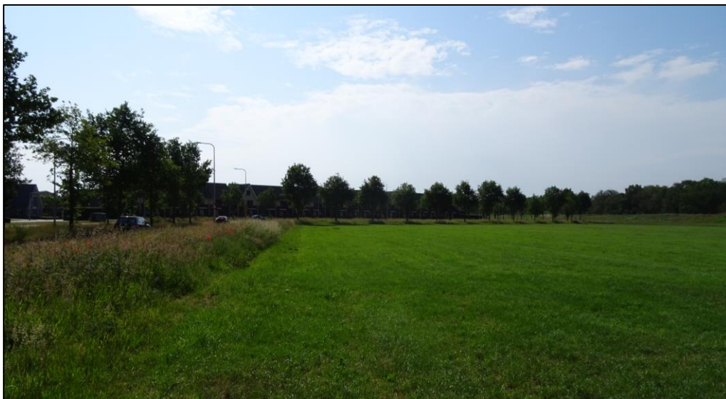
Impressie huidige situatie plangebied (bron: SAB).

Het plangebied van voorliggend plan betreft de nog onontwikkelde kantoorlob langs de Burgemeester Zuidwijklaan. Het perceel is circa 17.000 m 2 groot en ingericht als grasland. Ten zuidoosten van het plangebied is een geluidswal aangelegd ten gevolge van het geluid dat de N35 produceert. Langs de N-weg zijn ook groenstructuren terug te vinden. Navolgende afbeelding geeft een impressie van de huidige situatie van het plangebied weer.