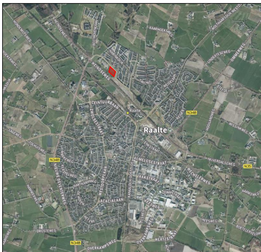
Globale ligging plangebied binnen de kern Raalte (rood omlijnd).

Het plangebied bestaat uit een onbebouwd perceel aan de zuidkant van Raalte Noord. Specifiek gaat het om het perceel ten zuiden van de Burgemeester Zuidwijklaan. Onderdeel van het plan is tevens het realiseren van de nieuw stukje geluidwal langs de N35. Op de navolgende afbeeldingen zijn de globale ligging en begrenzing van het plangebied weergegeven. De exacte begrenzing van het plangebied is op de verbeelding van dit bestemmingsplan weergegeven.