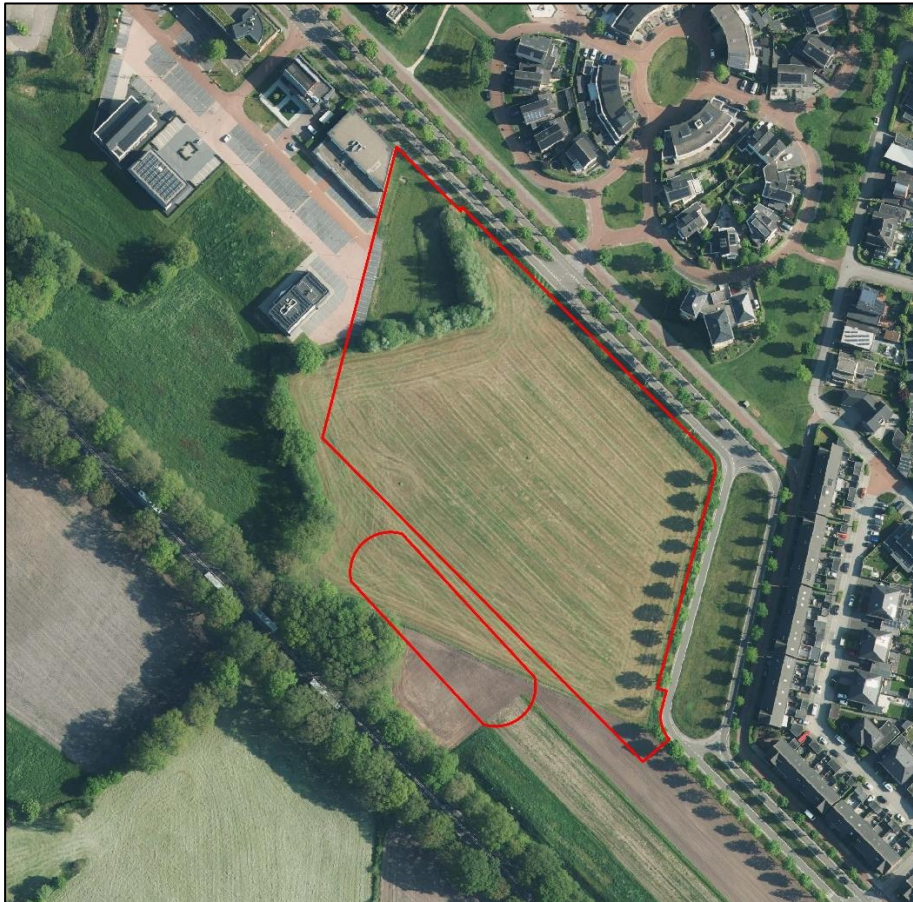
Globale begrenzing plangebied (rode arcering).