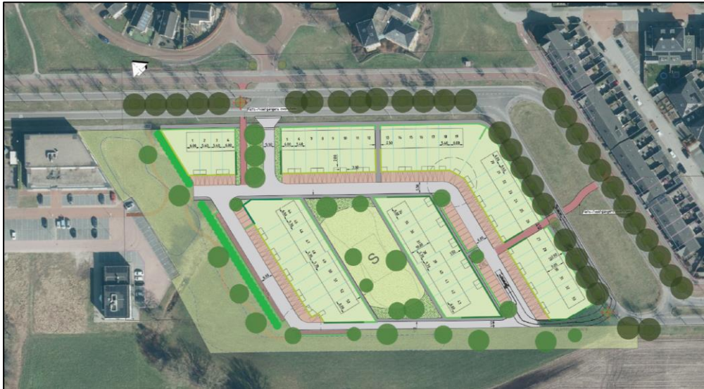
Inrichtingsplan Bredenhorst.

Zuidwijkstraan verder begeleid. Het binnengebied van Bredenhorst krijgt een meer informeel karakter waar de woningen niet verplicht in één gevellijn hoeven te worden gebouwd en de woningen georiënteerd worden op openbaar groen dat tevens een functie krijgt voor speel- en watervoorzieningen. Deze waterbergingsvoorziening wordt in verbinding gebracht met de waterbergingsmogelijkheid in de groene wig ten oosten van het plangebied. Om binnen het plangebied een goed woon- en leefklimaat te realiseren wordt er een nieuwe geluidwal met een hoogte van 5 meter langs de N35 gerealiseerd.