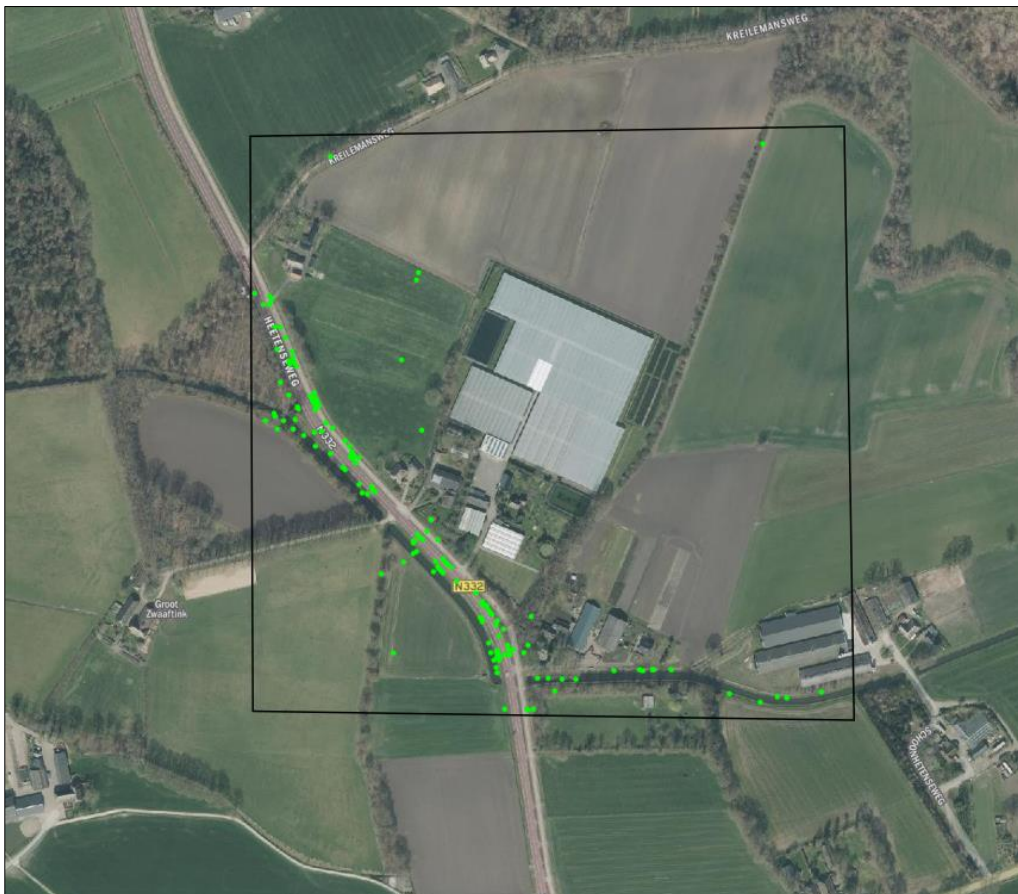
Verspreiding van alle bekende records in het plangebied.

Op 6 april 2023 is de NDFD geraadpleegd en is gekeken of waarnemingen van beschermde planten en dieren aanwezig zijn in de databank. In een ruime begrenzing van het zoekgebied rondom het plangebied, zijn 151 verschillende waarnemingen bekend in de NDFD. Voor de verspreiding van de waarnemingen, zie luchtfoto onder.