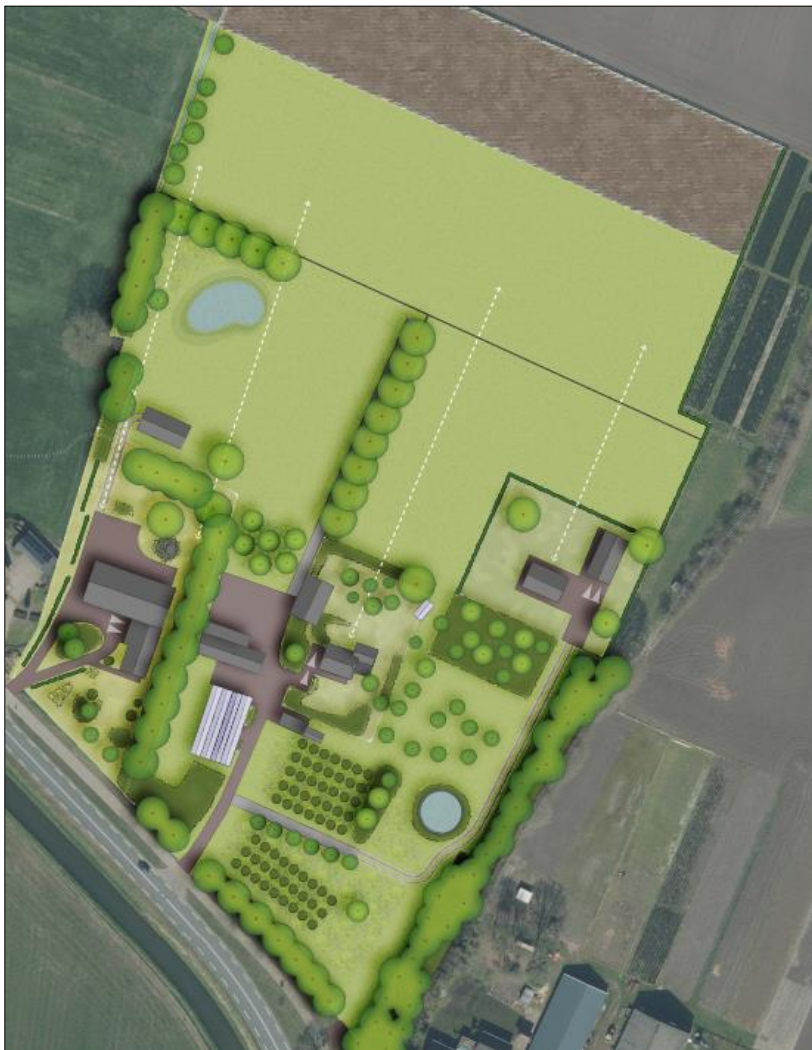
Verbeelding van het wenselijk eindbeeld.

Het voornemen bestaat om een extra woning en twee schuren in het plangebied te realiseren. Om deze nieuwbouw te realiseren dienen de kassen en de twee aanwezige schuren gesloopt te worden. De twee waterbassins worden verwijderd en er wordt in het noordelijke deel van het plangebied een natuurlijke vijver aangelegd. Aangenomen wordt dat een deel van de bestaande erfverharding verwijderd wordt en dat er nieuwe erfverharding wordt aangelegd. Tevens wordt aangenomen dat er enkele bomen en heesters verwijderd worden. Het plangebied wordt nadien landschappelijk ingepast, middels aanplant van een erfbeplanting, bomenrijen, walnotengaard, hazelnootgaard, hagen, bomensingels en solitaire bomen. Op onderstaande afbeelding is een verbeelding van het wenselijk eindbeeld weergegeven.