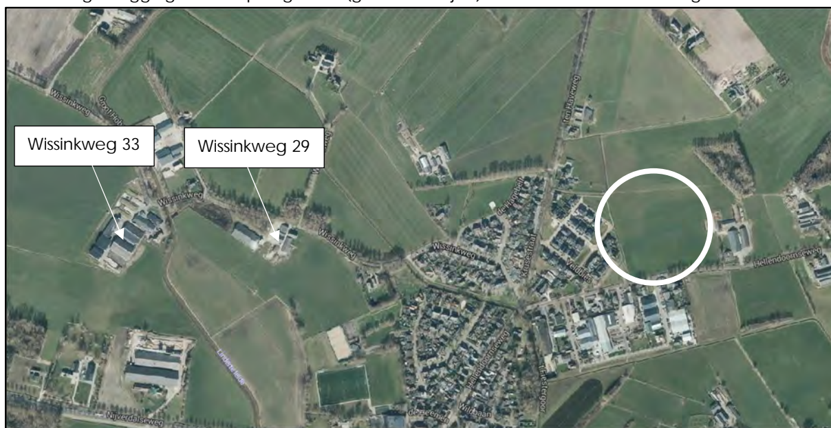
Afbeelding 4: Ligging van het plangebied (globaal omlind) in relatie tot de Wissinkweg 29 en 33

Aan de Wissinkweg 29 bevindt zich een varkenshouderij. Voor varkenshouderijen gelden geen vaste afstandseisen, maar wordt de geurhinder bepaald op basis van geuremissiefactoren. De varkenshouderij ligt op een afstand van ruim 700 meter tot de dichtstbijzijnde woning in het plangebied.