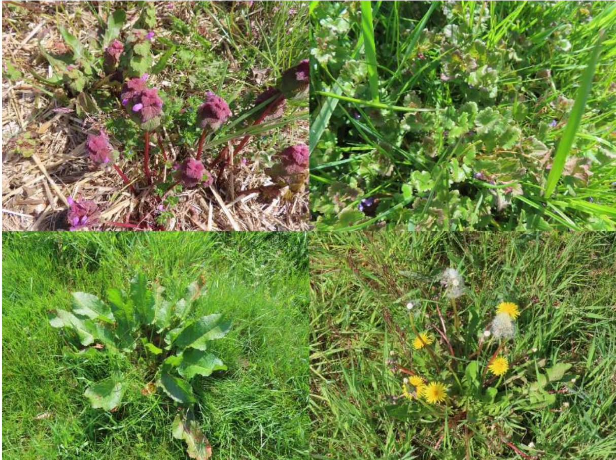
Figuur 2.1. Een impressie van de vegetatie binnen en vlak buiten het plangebied, met paarse dovenetel, hondsdraf, ridderzuring en paardenbloem.

Binnen beide deelgebieden werden soorten aangetroffen als paarse dovenetel, paardenbloem, pinksterbloem, ridderzuring, hondsdraf en grote brandnetel. Tijdens het veldbezoek zijn in het gehele plangebied geen beschermde plantensoorten aangetroffen, noch is het geschikte biotoop hiervoor aanwezig. De onder de Wnb beschermde plantensoorten stellen veelal kritische eisen aan hun standplaatsen. Aan deze eisen wordt binnen het plangebied niet voldaan. De omstandigheden zijn te voedselrijk.