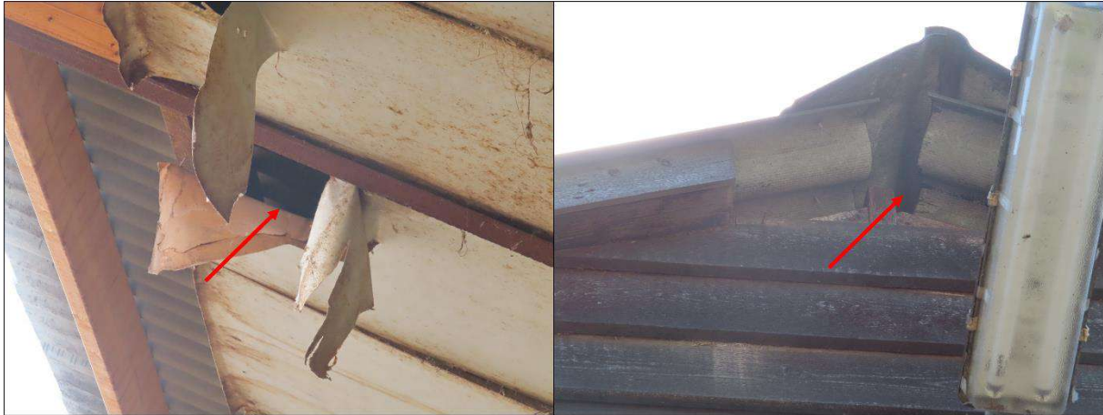
Figuur 2.6. In- en uitvliegopeningen naar een nest van kauw, tevens geschikt voor steenuil.

De aanwezigheid van andere jaarrond beschermde nesten binnen de invloedssfeer van het planvoornemen kan op voorhand worden uitgesloten op basis van habitateigenschappen, bevindingen tijdens het veldbezoek en verspreidingsgegevens (NDFF). Zo werden ten tijde van het veldbezoek geen braakballen of andere sporen van kerkuilen aangetroffen. Hoewel de woning in deelgebied A tevens geschikte nestgelegenheid biedt voor een soort als spreeuw, is deze soort binnen de provincie Overijssel aangewezen als 'categorie 5' soort, wat inhoudt dat de nesten van deze soort slechts jaarronde bescherming genieten indien de omgeving hiervan geen geschikte alternatieve nestgelegenheid biedt. Gezien de ligging van het plangebied vlak buiten de bebouwde kom van Mariënheem, waar woningen met gegolfde dakpannen diverse geschikte nestlocaties bieden is hier naar ons inzicht geen sprake van en zijn eventuele nesten van spreeuwen niet jaarrond beschermd. Deze nesten zijn slechts beschermd wanneer er sprake is van een broedgeval.