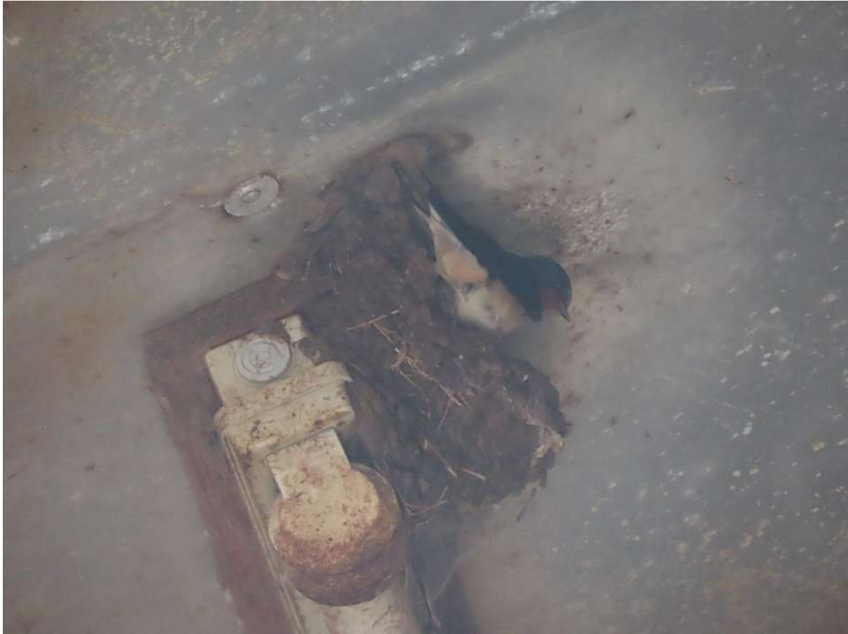
Figuur 2.5. Een bezet nest van boerenzwaluw in stalling 1 binnen deelgebied A.

Op korte afstand van het plangebied (ca. 1 km), aan de Keizersveldweg, zijn in de afgelopen vijf jaar diverse waarnemingen gedaan van nest-indicerende steenuilen (bron: NDFF). Sinds mei 2021 is deze soort hier niet meer waargenomen. De kans bestaat dat een broedpaar dit gebied inmiddels heeft verlaten om zich elders te vestigen. Stalling 1 in deelgebied A biedt naar ons inzicht geschikte broedgelegenheid voor deze soort, in de vorm van de ruimte tussen de gegolfde dakplaten en de hieronder bevestigde betimmering. Ten tijde van het veldbezoek bleek deze ruimte groot genoeg voor het nest van een kauw, welke in- en uitvliegend werd waargenomen tijdens het veldbezoek. Op basis hiervan kan de aanwezigheid van een jaarrond beschermd nest van steenuil binnen deelgebied A naar ons inzicht niet op voorhand worden uitgesloten. Het leefgebied van steenuil is relatief klein. Indien in deelgebied A sprake is van een nestplaats, dan wel een vaste verblijfplaats kan niet op voorhand worden uitgesloten dat deelgebied B voor deze soort tevens essentieel is als leefgebied en dat de voorgenoemde werkzaamheden gepaard gaan met negatieve effecten hierop.