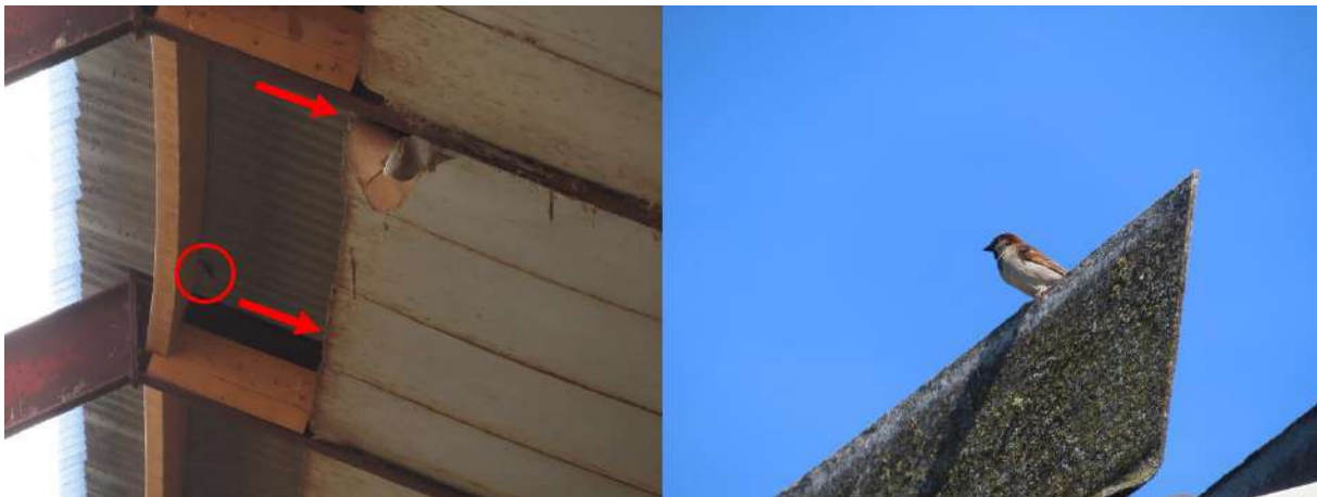
Figuur 2.2. In stalling 1 werd een drietal huismusnesten vastgesteld (links) en op het dak van stalling 2 werd territoriale zang waargenomen (rechts).

In stalling 1 binnen deelgebied A, zoals weergegeven in figuur 1.3, werd tijdens het veldbezoek een drietal huismusnesten vastgesteld in de ruimte tussen de gegolfde dakplaten en de daaronder bevestigde betimmering. Ook werd territoriale zang van huismus mannen waargenomen op het dak van stalling 2 (figuur 2.2). Hoewel er geen nest-indicerend gedrag werd waargenomen rond de woning in deelgebied A, bieden ruimten onder gegolfde dakpannen op het dak hiervan wel geschikte nestgelegenheden voor deze soort. De aanwezigheid van meer jaarrond beschermde nesten van huismussen binnen deelgebied A kan niet op voorhand worden uitgesloten. De aanwezigheid van jaarrond beschermde nesten van deze soort binnen deelgebied B kan wel op voorhand worden uitgesloten.