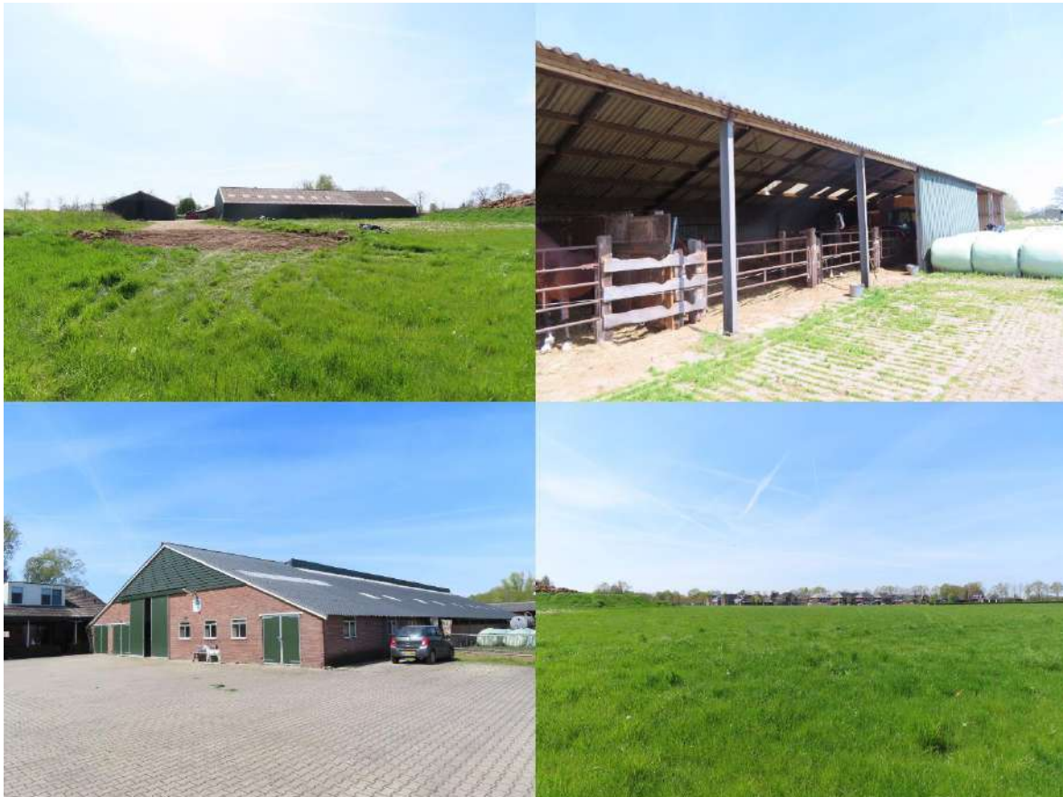
Figuur 1.2. Een impressie van het plangebied.

Het planvoornemen bestaat uit het (deels) slopen van de opstallen en het verwijderen van de aanwezige verharding en erfbepanting binnen deelgebied A. In deelgebied B wordt een uitbreidingswijk gerealiseerd. Mogelijk wordt deelgebied A opgenomen als onderdeel van de uitbreidingswijk. De omliggende sloten en houtopstand worden binnen het planvoornemen niet aangetast. Mogelijk wordt slechts een niet-jaarrond waterhoudende ontwateringsgreppel tussen deelgebieden A en B gedempt.