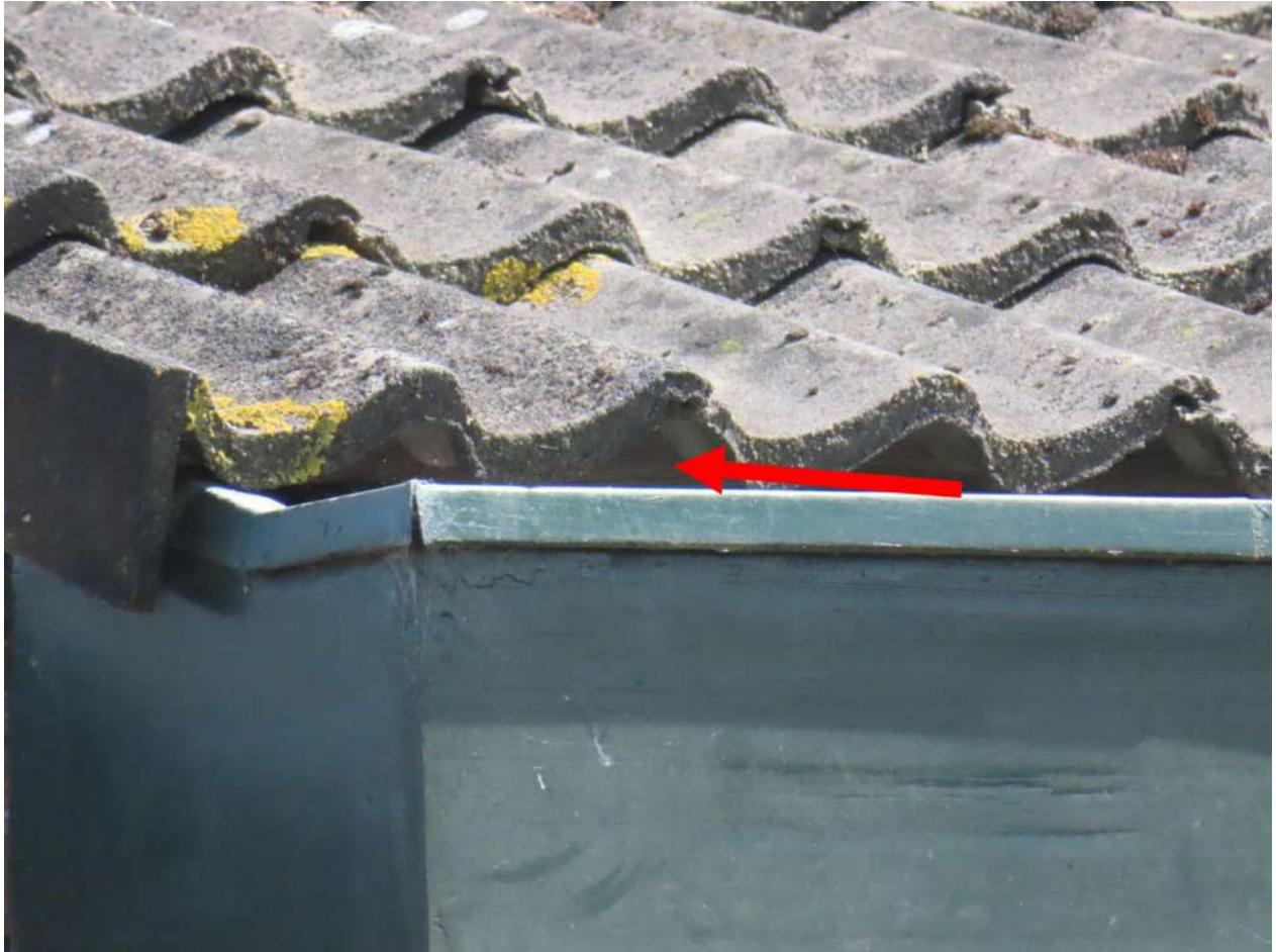
Figuur 2.3. Ruimten onder de gegolfde dakpannen op de woning binnen deelgebied A bieden geschikte nestgelegenheden voor huismussen.