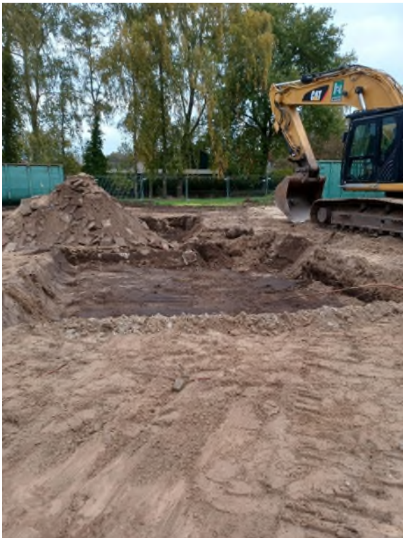
Figuur B2.2 Ontgraving