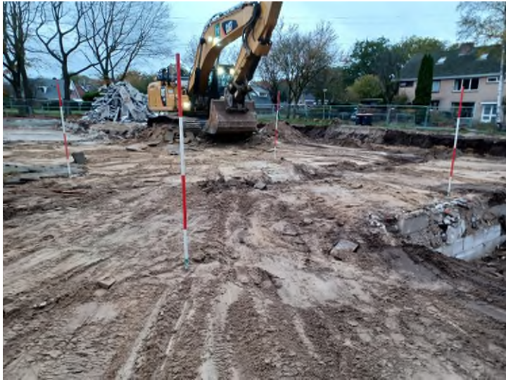
Figuur B2.1 Uitgezette verontreiniging