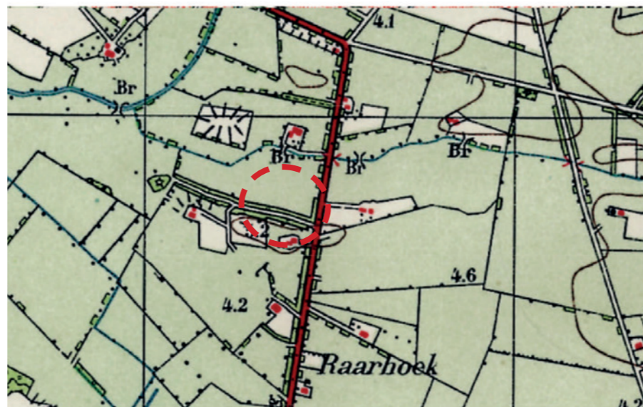
Afbeelding 6. Historische kaart rond 1950