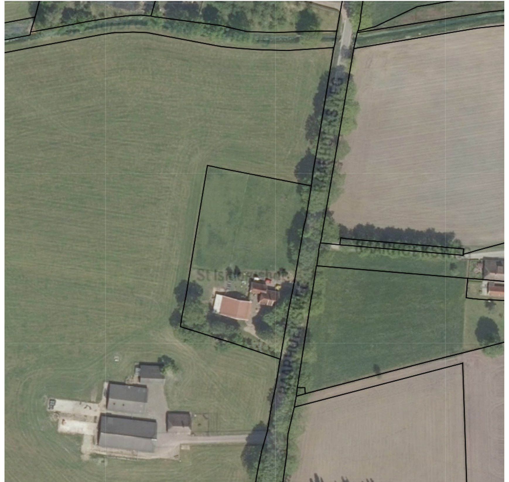
Afbeelding 2. Luchtfoto van het erf, en de bebouwing

Het perceel aan de Raarhoeksweg ligt in het buitengebied ten noorden van Raalte. Het perceel bestaat uit een woning en een aantal schuren. Het heeft een oppervlakte van 6.350 m 2 . De bebouwing bestaat uit een woning en een vijstaande schuur en ligt in een open landschap waar de agrarische bedrijven de boventoon voeren. De heer Westenek is voornemens een nieuwe woning te bouwen op het perceel aan de noordzijde van de bestaande woning.