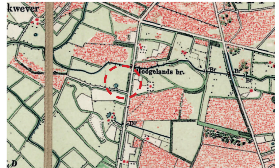
Afbeelding 5. Historische kaart rond 1900