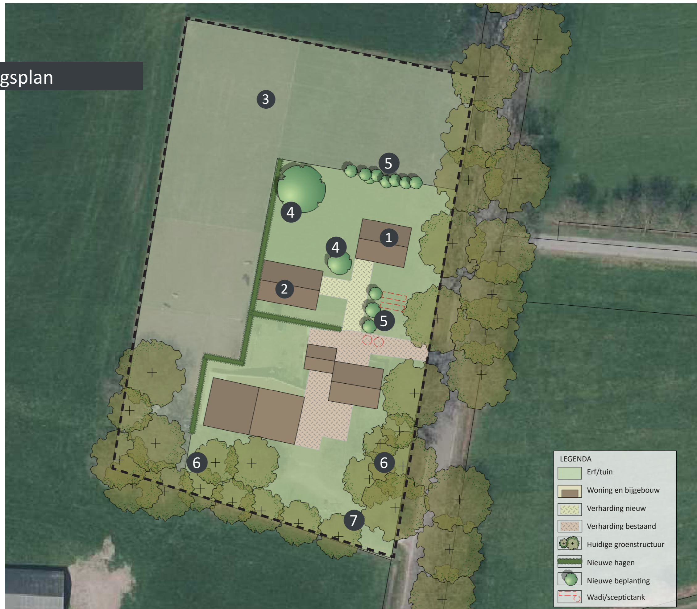
Afbeelding 11. Schets landschappelijke inpassing