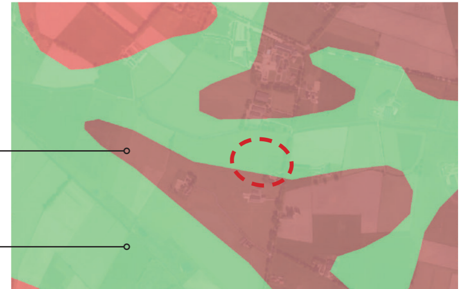
Afbeelding 3. Bodemkaart