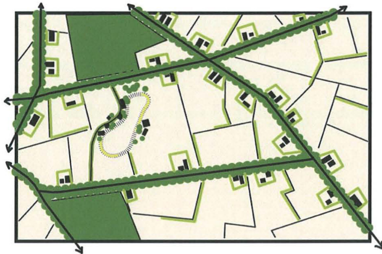
Afbeelding 8. Gewenst landschapsbeeld 'dekzandvlakte' volgens het LOP