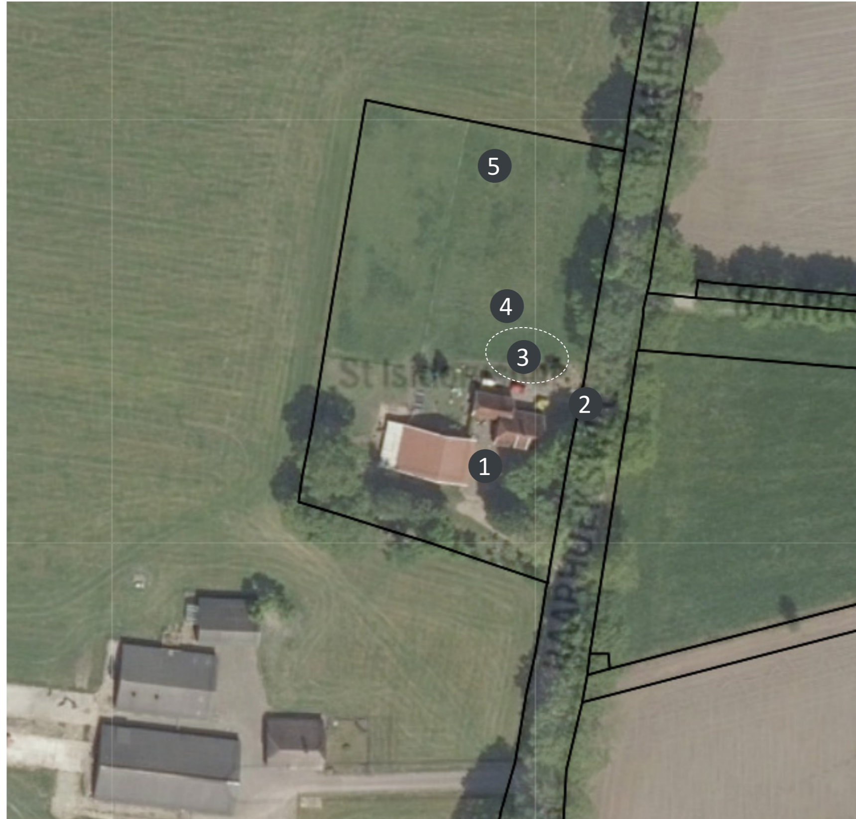
Afbeelding 10. Uitgangspunten/randvoorwaardenkaart