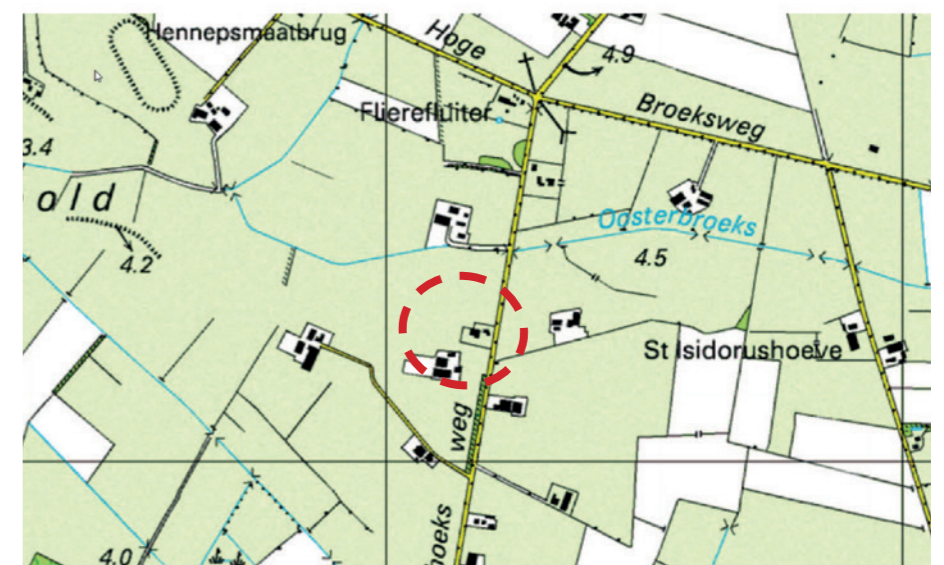
Afbeelding 7. Historische kaart rond 2010