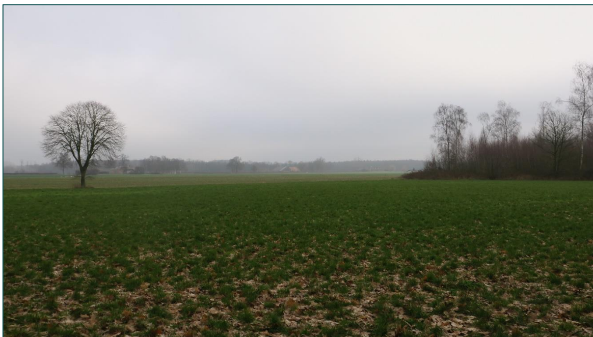
Figuur 1 De planlocatie is gelegen aan de Zuthemerweg ong. te Laag Zuthem en bestaat uit een weiland met een boom erop gesitueerd. De beoogde ruimtelijke ingreep betreft de realisatie van 5 woningen.