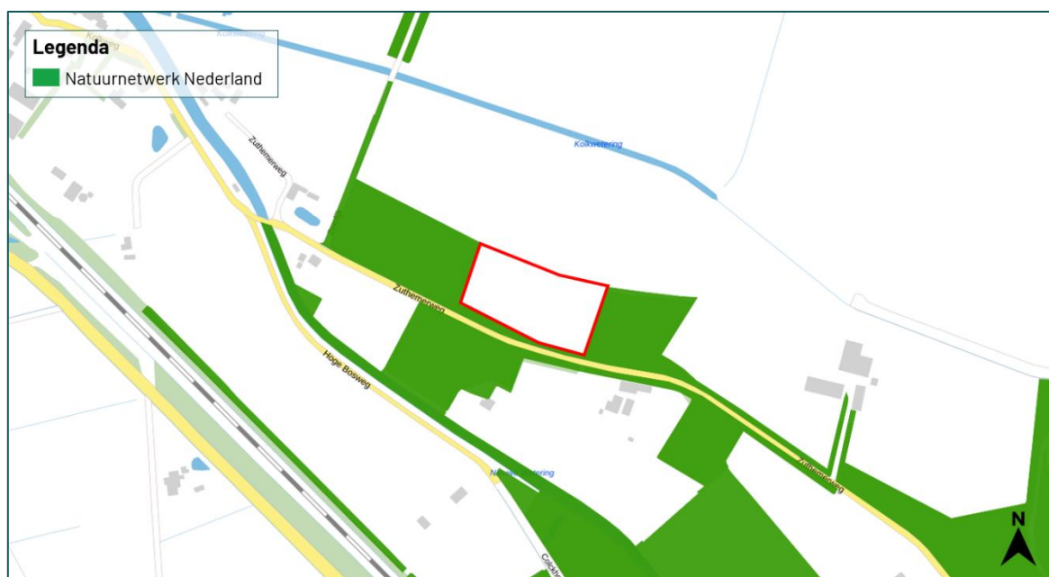
Figuur 3.3 De planlocatie grenst aan het Natuurnetwerk Nederland (bron: www.Overijssel.tercera-ro.nl ).