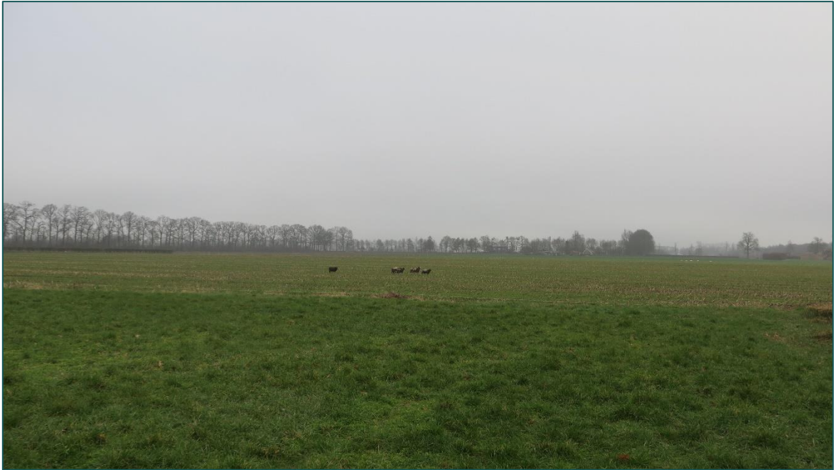
Figuur 3 Ten noorden van de planlocatie is een agrarisch perceel gesitueerd met begrazing van schapen.