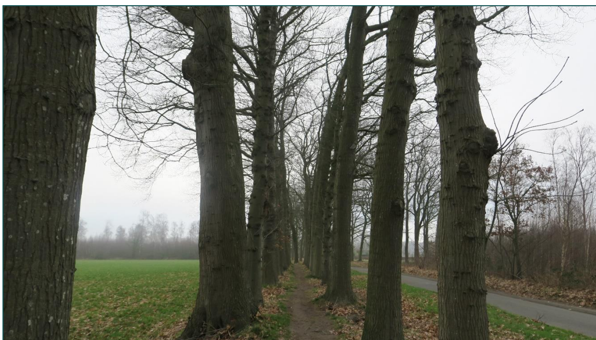
Figuur 2 Een bomenlaan met voetpad grenzend ten zuiden van de planlocatie. In de beoogde ruimtelijke ingreep zijn geen kapwerkzaamheden voorzien.