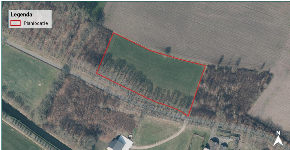
Figuur 1.2 De planlocatie (rood omkaderd) is gelegen aan de Zuthemerweg ong. te Laag Zuthem.

De planlocatie is gelegen aan de Zuthemerweg ong. te Laag Zuthem (figuur 1.2). De planlocatie betreft een weiland met een boom erop gesitueerd. Het perceel kent een goed onderhoudsbeeld, waarbij de planlocatie meermaals per jaar wordt gemaaid. Er is geen sprake van verharding en er is geen oppervlaktewater aanwezig op de planlocatie. Gelegen ten zuiden van de planlocatie is een bomenrij gesitueerd. Binnen de beoogde ruimtelijke ingreep wordt deze niet aangetast. In figuur 1.3 en bijlage 1 zijn een aantal foto's opgenomen die een impressie geven van de planlocatie en de directe omgeving hiervan.