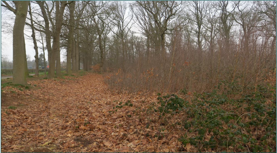
Figuur 1.3 Fotografische indruk van de omgeving van de planlocatie.