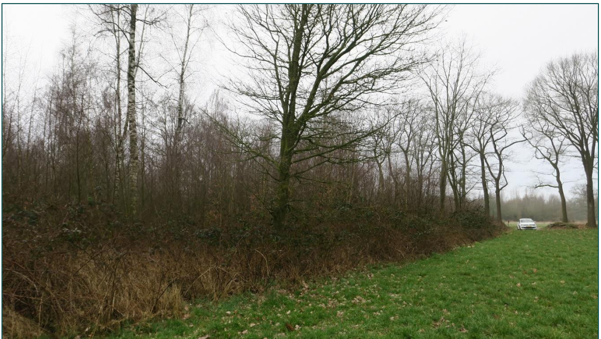
Figuur 4 De planlocatie is gelegen naast een bosgebied. Deze groenstructuren blijven binnen de beoogde ruimtelijke ingreep behouden.