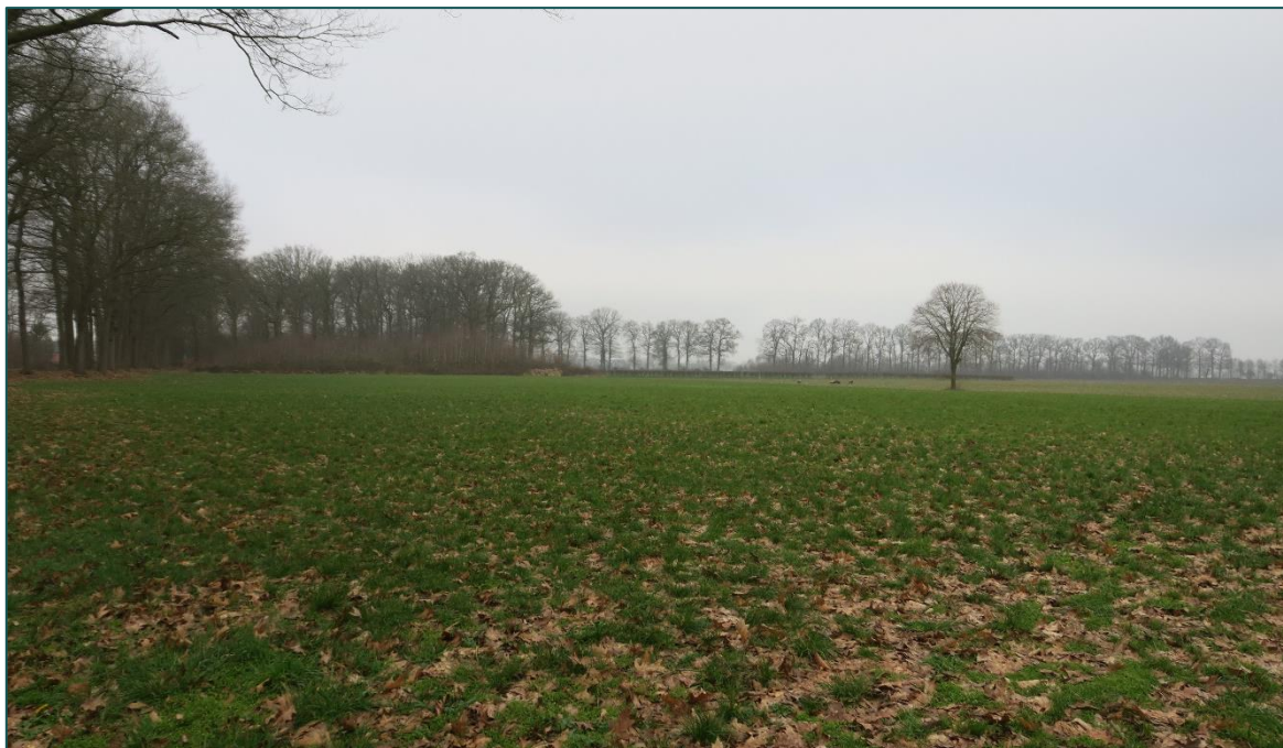
Figuur 1.1 De planlocatie is gelegen aan de Zuthemerweg ong. te Laag Zuthem.