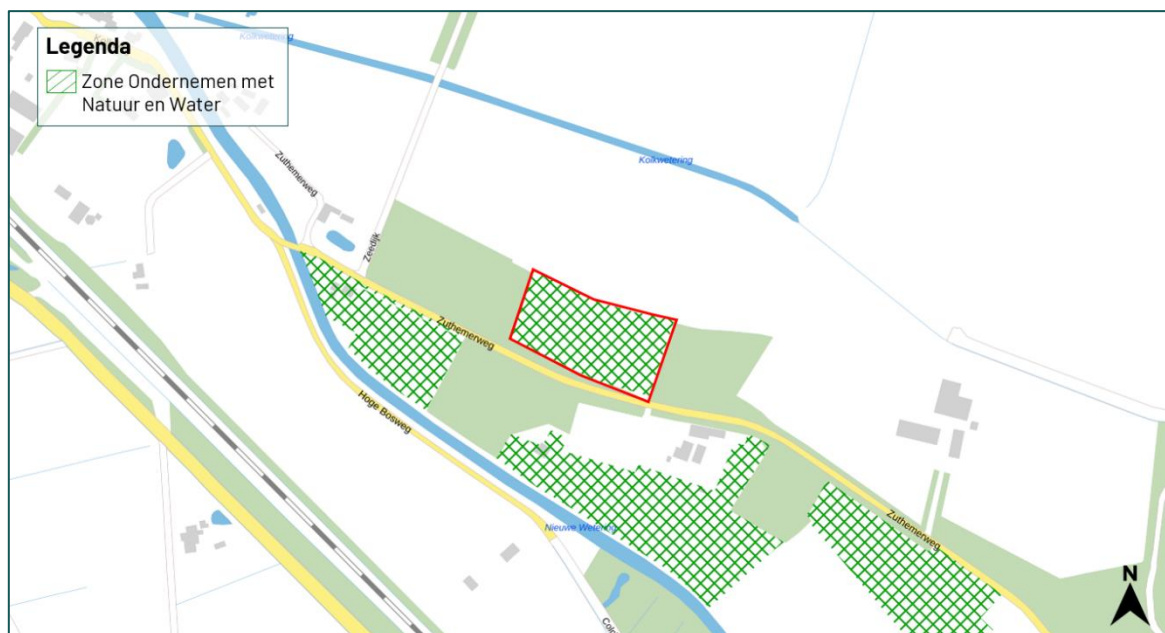
Figuur 3.2 De planlocatie ligt in de Zone Ondernemen met Natuur en Water.

In de beoogde ruimtelijke ontwikkeling is rekening gehouden met de versterking van de natuur en landschapswaliteiten, gezien er naast de realisatie van 5 woningen ook een bloemrijk grasland en fruitbomen worden gerealiseerd. De hoeveelheid verharding die wordt aangebracht is beperkt, waardoor er naar verwachting geen effecten ontstaan op de plaatselijke waterhuishouding. Om verder te kunnen bijdragen aan de natuur- en landschapswaliteiten van de Zone Ondernemen Natuur en Water kan het bloemrijk grasland extensief worden beheerd (o.a. gefaseerd maaien) en nestkasten worden opgehangen in de fruitbomen, bijvoorbeeld een nestkast van een steenuil. Tevens wordt aangeraden om zo min mogelijk verharding te realiseren. Dit om de waterhuishouding zo min mogelijk aan te tasten. Op deze manier kan de ontwikkeling gepaard gaan met het bijdragen aan de natuur- en landschapswaliteiten binnen de Zone Ondernemen met Natuur en Water, en is de ontwikkeling dus niet strijdig met het vigerende beleid.