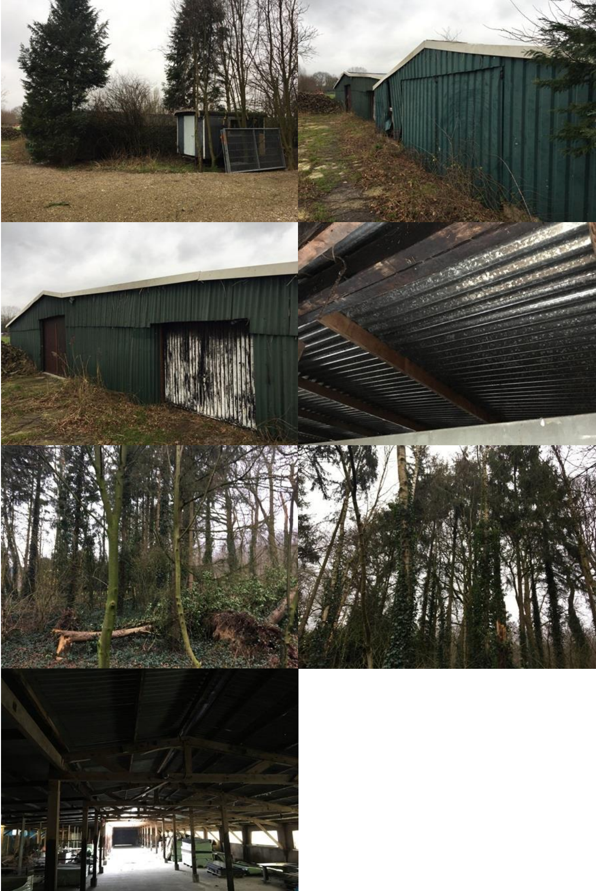
Bijlage 3. Fotobijlage. Impressie van het plangebied en de directe omgeving.