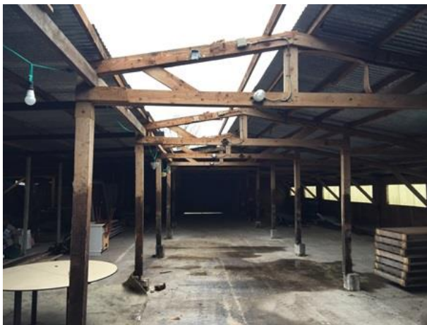
Delen van het dak zijn weg; dit biedt vogels de kans om in het gebouw te nestelen.

Het plangebied behoort tot het functionele leefgebied van verschillende vogelsoorten. Vogels benutten het plangebied hoofdzakelijk als foerageergebied, maar mogelijk nestelen er ook vogels in de beplanting, in de bebouwing en in dichte vegetatie op de grond. Soorten die mogelijk in het plangebied nestelen zijn merel, vink, houtduif, holenduif, koolmees, pimpelmees, witte kwikstaart, tjiftjaf, zwartkop en goudhaan. Er zijn tijdens het veldbezoek geen huismussen, steen- of kerkuilen in het plangebied waargenomen. Door het uitvoeren van de voorgenomen activiteiten kunnen vogelnesten beschadigd en vernield worden.