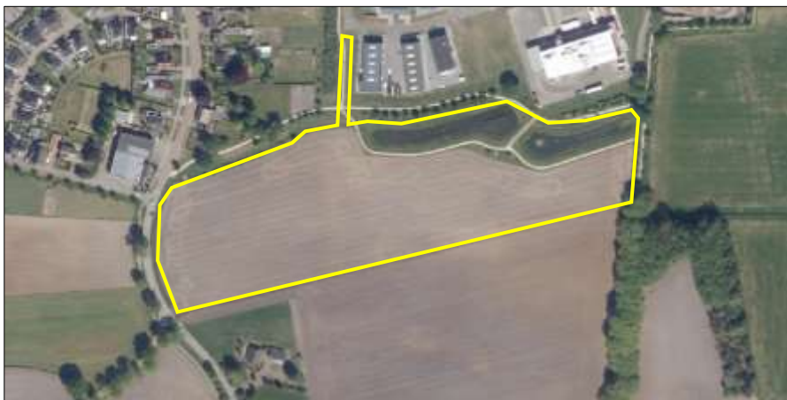
Begrenzing van het plangebied; deze wordt met de gele lijnen aangeduid.

Het plangebied bestaat uit kavelgrenssloten, twee vijvers, verharde weg en agrarische cultuurgrond, tijdens het veldbezoek in gebruik als maisland. Deze maislanden worden intensief beheerd. In het plangebied loopt een deel van de Poelweg. Het plangebied grenst aan gazon, verharde weg en agrarisch cultuurgrond. Op onderstaande luchtfoto is de begrenzing van het plangebied aangegeven. Voor een impressie van het plangebied wordt verwezen naar de fotobijlage.