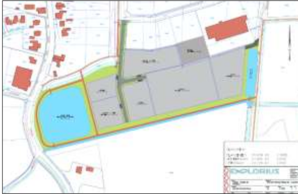
Verbeelding van het wenselijk eindbeeld.

Er zijn plannen om het bedrijventerrein Telgen III uit te breiden. Er wordt bebouwing gerealiseerd en er worden waterbuffers en nieuwe wegen aangelegd. De twee vijvers en kavelgrensloten worden gedempt. Op onderstaande afbeelding wordt een plattegrond van het wenselijk eindbeeld weergegeven.