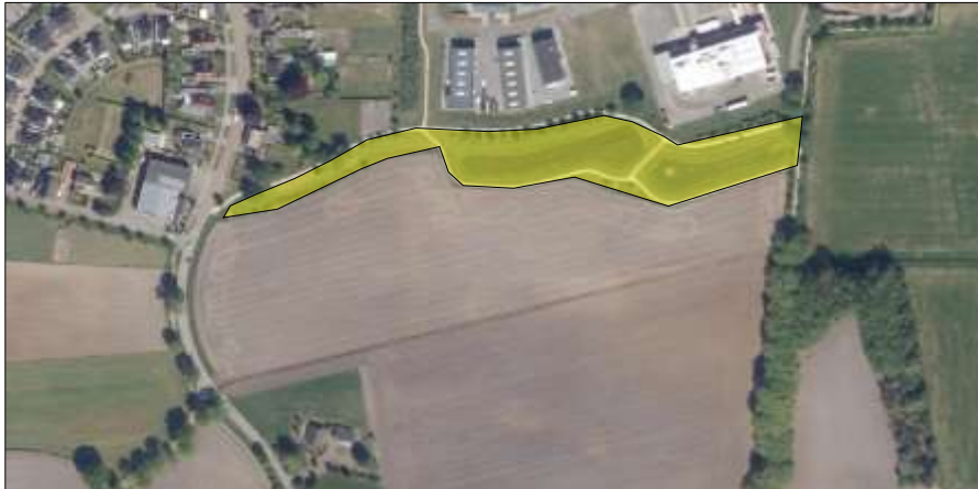
Op bovenstaande luchtfoto wordt het functionele leefgebied van amfibieën weergegeven.

Door het dempen van de vijver en het uitvoeren van grondverzet rondom de vijvers wordt mogelijk een amfibie gedood en wordt een winterrust- en voortplantingsplaats van amfibieën beschadigd en vernield.