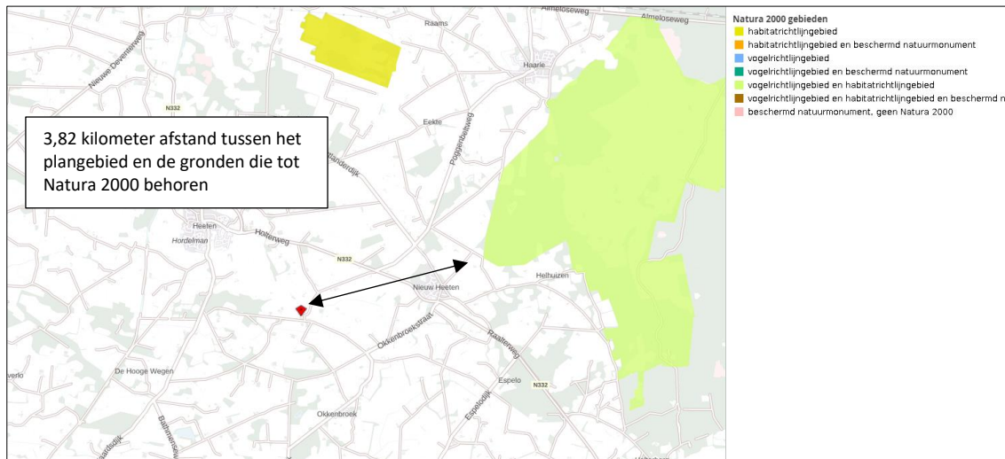
Ligging van Natura 2000-gebied in de omgeving van het plangebied. De ligging van het plangebied wordt met de rode marker aangeduid. Gronden die tot Natura 2000 behoren worden met de okergele kleur aangeduid.

Het plangebied ligt op minimaal 3,82 kilometer afstand van Natura 2000-gebied. Het meest nabij gelegen Natura 2000-gebied, is Sallandse Heuvelrug. Er liggen nog andere Natura 2000-gebieden in de omgeving van het plangebied maar deze liggen op grotere afstand. Op onderstaande afbeelding wordt de ligging van het Natura 2000-gebied in de omgeving van het plangebied weergegeven.