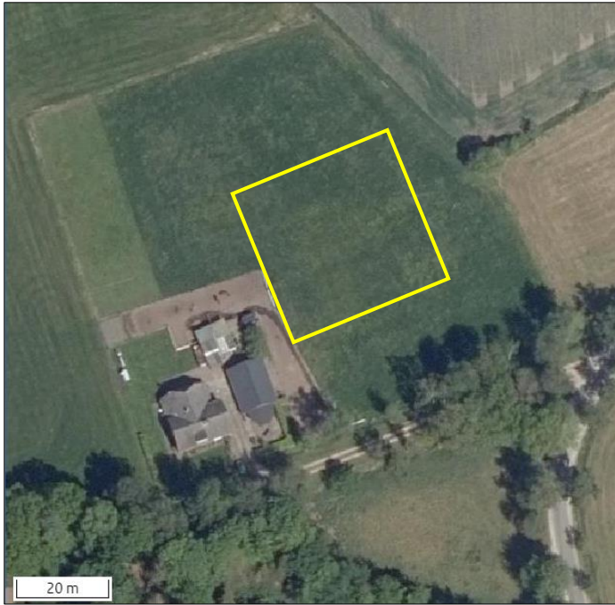
Begrenzing van het plangebied wordt met de gele lijn aangeduid.