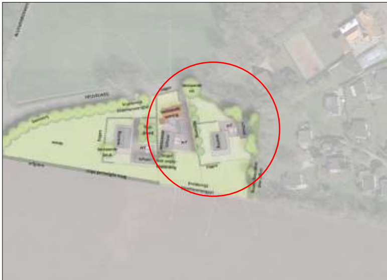
Verbeelding van het wenselijk eindbeeld (bron: BiedtRuimte).

Het voornemen bestaat om in het plangebied een nieuw woonerf te realiseren. Op dit nieuwe woonerf komt een nieuwe woning en een nieuwe schuur. Het nieuwe woonerf wordt d.m.v. een nieuw aan te leggen verharde inrit in verbinding gebracht met het westelijk gelegen erf (Heuvelweg 11) en de Heuvelweg. Het nieuw erf wordt nadien landschappelijk ingepast d.m.v. de aanplant van erfbeplanting. Op onderstaande afbeelding wordt een plattegrond van het wenselijk eindbeeld weergegeven.