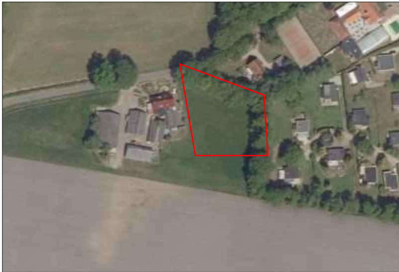
Begrenzing van het onderzoeksgebied wordt met de rode lijn aangeduid

Om het effect van de voorgenomen activiteiten volledig in beeld te kunnen brengen, is een strook van 10 meter ten noorden en oosten van het plangebied meegenomen in het onderzoek. Indien in dit rapport gesproken wordt over plangebied, wordt onderstaand onderzoeksgebied bedoeld.