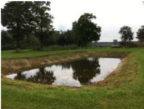
Te dempen poel in het plangebied.

Tijdens het veldbezoek zijn geen amfibieën waargenomen, maar gelet op de inrichting en het gevoerde beheer, wordt het plangebied als functioneel leefgebied voor sommige amfibieënsoorten beschouwd. Amfibieën als bruine kikker, bastaardkikker, kleine watersalamander en gewone pad benutten het plangebied mogelijk als foerageergebied en mogelijk benutten ze de poel als voortplantingsbiotoop.