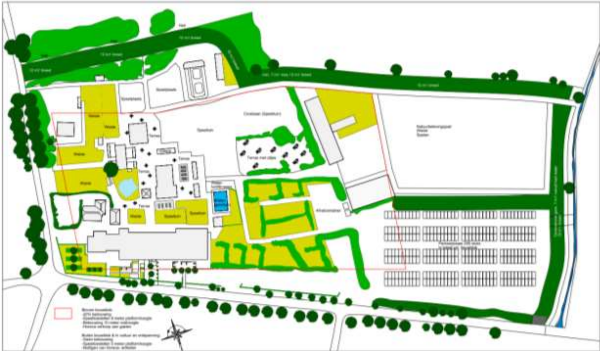
Plattegrond van het volledige bedrijf, inclusies wenselijke ontwikkelingen.

Er zijn verschillende initiatieven. Deels hebben die betrekking op de inrichting van de buitenruimte van het bestaande park. Er zijn echter ook plannen die leiden tot de uitvoering van fysieke werkzaamheden of het wijzigen van het huidige gebruik.