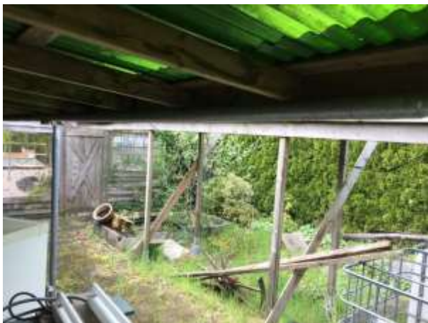
Amfibieën kunnen een vaste (winter)rustplaats bezetten onder opgeslagen spullen en rommel

Tijdens het veldbezoek zijn geen amfibieën waargenomen, maar gelet op de inrichting en het gevoerde beheer, wordt het plangebied als functioneel leefgebied voor sommige algemene en weinig kritische amfibieënsoorten beschouwd. Amfibieën als bruine kikker, kleine watersalamander en gewone pad benutten het plangebied als foerageergebied en mogelijk bezetten ze er een (winter)rustplaats. Deze soorten kunnen een (winter)rustplaats bezetten onder opgeslagen spullen/rommel, onder strooisel en bladeren en in holen en gaten in de grond. Amfibieën benutten de vijver als foerageergebied en mogelijk bezetten ze er een (winter)rustplaats. De bebouwing is voor amfibieën niet toegankelijk om te betreden. Het plangebied wordt niet als functioneel leefgebied van zeldzame amfibieënsoorten als kamsalamander, rugstreeppad of poelkikker beschouwd. De vijver in het plangebied kan dienen als potentieel voortplantingsbiotoop.