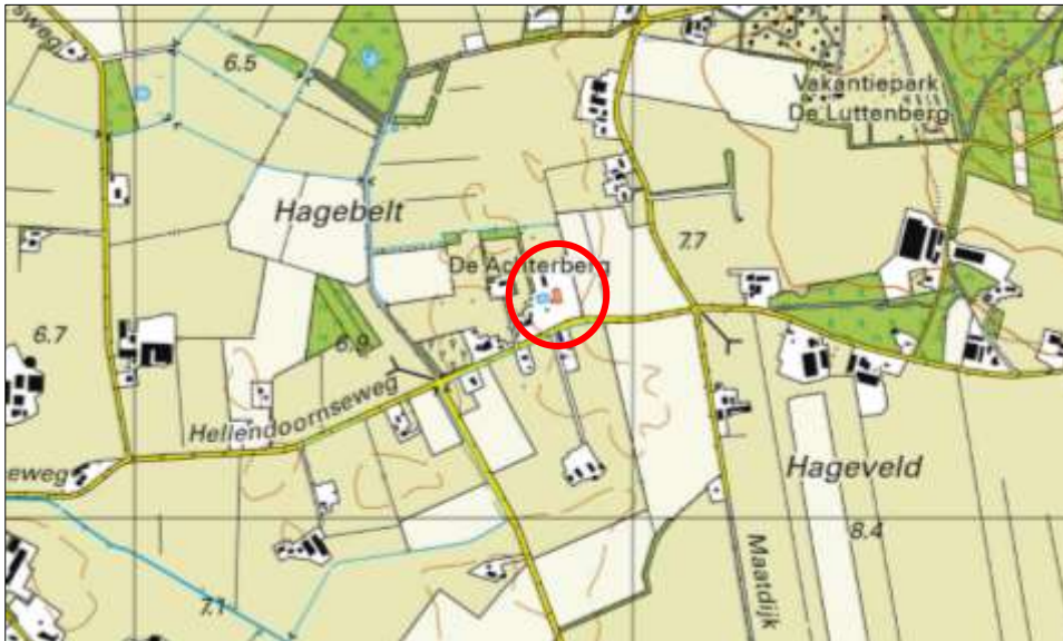
Globale ligging van het plangebied. De ligging van het plangebied wordt met de rode cirkel aangeduid.

Het plangebied is gesitueerd aan de Hellendoornseweg 61 te Luttenberg, gemeente Raalte. Het ligt circa 1,75 kilometer ten zuiden van de woonkern van Luttenberg en wordt omgeven door landelijk gebied. Op onderstaande afbeelding wordt de globale ligging van het plangebied weergegeven op een topografische kaart.