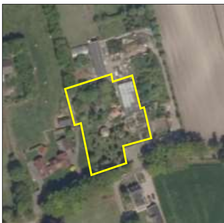
Begrenzing van het plangebied; deze wordt met de gele lijnen aangeduid.

Het plangebied vormt een deel van het tuincentrum "De Achterberg". Het bestaat uit bebouwing, beplanting, erfverharding, opgeslagen spullen/rommel en een vijver. De bebouwing bestaat uit schaduwhallen, kassen en twee bijgebouwen. De bijgebouwen zijn volledig van hout en zijn betimmerd met houten planken (schaaldelen) en zijn gedekt met riet. De bijgebouwen en de vijver zijn gesitueerd in het centrale deel van het plangebied. De schaduwhallen en kassen staan in het oostelijke deel van het plangebied. De beplanting bestaat uit loofbomen, naaldbomen, enkele hagen (o.a. conifeer), sierplanten, struiken en ruigte. De meeste loof- en naaldbomen staan in het noordelijke deel van het plangebied. De overige beplanting staat verspreid door het plangebied. De opgeslagen spullen/rommel liggen verspreid in de buitenruimte van het plangebied. Op onderstaande luchtfoto is de begrenzing van het plangebied aangegeven. Voor een impressie van het plangebied wordt verwezen naar de fotobijlage.