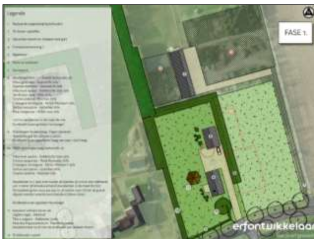
Verbeelding van het wenselijk eindbeeld.

Er zijn plannen om de kassen, schaduwhallen en het meest noordelijk gelegen bijgebouw te slopen en nieuwbouw van een woning met bijgebouw te realiseren. De nieuwe woning wordt deels gebouwd op de bestaande locatie van het te slopen bijgebouw. Het meest zuidelijk gelegen bijgebouw blijft behouden. De nieuwe woning met bijgebouw worden d.m.v. een nieuw aan te leggen (verharde) inrit in verbinding gebracht met de Hellendoornseweg. Langs de binnenzijde van de oostelijke en noordelijke grens van het plangebied komt een houtsingel bestaande uit: Zwarte Els, Gewone Es, Geldersche roos, Vlier, Hazelaar, Meidoorn, Lijsterbes en Wilde roos. Langs de binnenzijde van de westelijke grens van het plangebied komt een gemende haag bestaande uit: Geldersche roos, Rode Kornoelje, Meidoorn, Lijsterbes en Hazelaar. Langs de binnenzijde van de zuidelijke grens van het plangebied komt aanplant van een beukenhaag. Tevens wordt in het zuidelijke deel een solitaire boom geplant. Aangenomen wordt dat voor het uitvoeren van de voorgenomen activiteiten een deel van de beplanting verwijderd wordt en dat een deel behouden blijft. Net voor het veldbezoek was er al een deel van de beplanting verwijderd. Tevens wordt aangenomen dat een deel van de bestaande erfverharding verwijderd en vervangen wordt en dat de vijver behouden blijft. Op onderstaande afbeelding wordt een plattegrond van het wenselijk eindbeeld weergegeven.