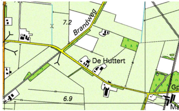
Figuur 3, topografisch kaart, anno 2018

In de huidige situatie zijn nog enkele restanten van houtsingel en bos aanwezig. Het gebied wordt gebruikt door de veehouderij. De percelen worden gebruikt als weide en voor de teelt van mais. In de jaren zestig zeventig van de vorige eeuw zijn in het kader van ruilverkaveling nieuwe houtwallen toegevoegd aan het landschap. Waarschijnlijk zijn deze toevoeging aan het landschap gedaan ter compensatie van het weghalen van oude kavelgrens beplantingen ten gunste van een effectievere landbouw.