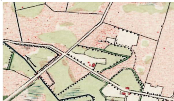
Figuur 2, topografische kaart rond 1900

Het erf is een oud erf en bestond reeds in 1880. Het landschap rondom het kleine agrarisch bedrijf rond 1900 was een heide- bos landschap. Direct rondom de boerderij was rond 1900 al kleinschalige akkerbouw en veehouderij. De percelen werden begrenst door kavelgrens bomen/houtwallen.