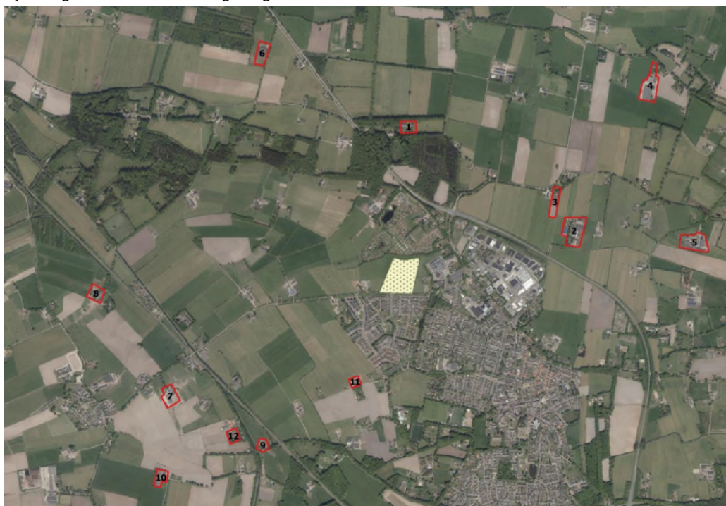
Figuur 1.1: Nieuwbouwplan perceel Molenweg en omliggende relevante veehouderijen

Op een afstand van minimaal 620 meter bevinden zich geurrelevante veehouderijen met dieren. Veehouderijen met dieren waarvoor een vaste afstand geldt vormen per definitie geen probleem, omdat deze afstand dan maximaal 100 meter bedraagt. Veehouderijen waarvoor een geuremissie geldt vormen mogelijk wel een aandachtspunt. In de onderstaande figuur is het plangebied met de omliggende relevante veehouderijen (met geuremissie) weergegeven die zijn aangeleverd door de Omgevingsdienst IJsselland.