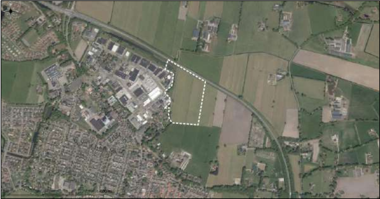
Figuur 2. Luchtfoto onderzoekslocatie en directe omgeving.