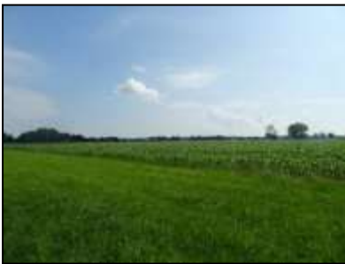
Figuur 3. De onderzoekslocatie vanaf het zuidwesten, bestaande uit groenstrook en akker (maïs).