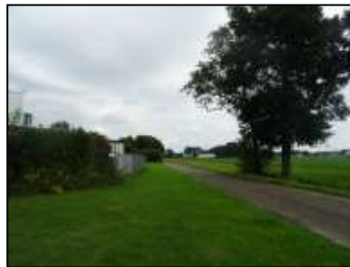
Figuur 4. De Lentheweg langs de westelijke zijde van de onderzoekslocatie.