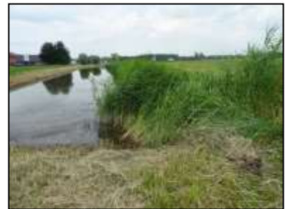
Figuur 5. De sloot ten noordwesten van de onderzoekslocatie.