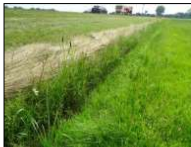
Figuur 7. Greppel tussen de N35 en de noordelijke zijde van de onderzoekslocatie.