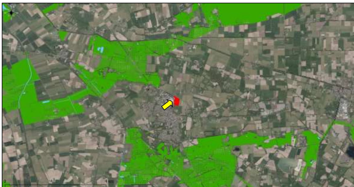
Figuur 15. Ligging onderzoekslocatie ten opzichte van het Natuurnetwerk Nederland.

De onderzoekslocatie maakt geen deel uit van het Natuurnetwerk. De onderzoekslocatie ligt echter wel in de nabijheid van een gebied, behorend tot het Natuurnetwerk Nederland. Het meest nabijgelegen gebied (Landgoederen Salland) bevindt zich circa 1 kilometer ten noordwesten van de onderzoekslocatie. In figuur 15 is de ligging van de onderzoekslocatie ten opzichte van het Natuurnetwerk Nederland weergegeven.