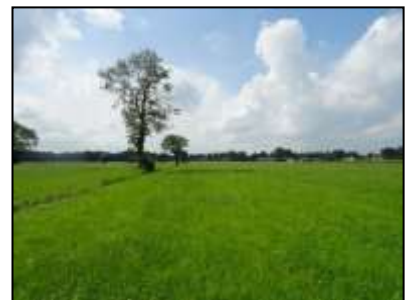
Figuur 8. Grasland, greppel en enkele bomen ten oosten van de onderzoekslocatie.