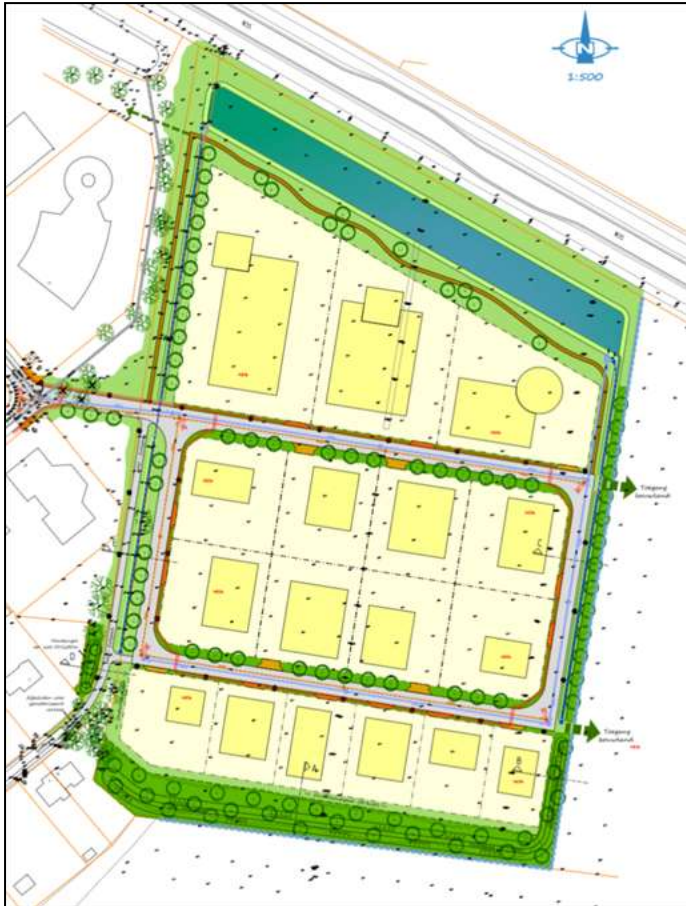
Figuur 9. Voorgenomen uitbreiding aan de oostelijke zijde van het bedrijventerrein Blankenfoort.

De initiatiefnemer is voornemens het huidige, naburige bedrijventerrein Blankenfoort uit te breiden aan de oostelijke zijde (figuur 9).