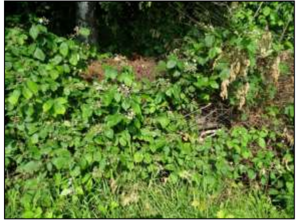
Figuur 13. Vegetatie met algemene soorten zoals gewone braam.