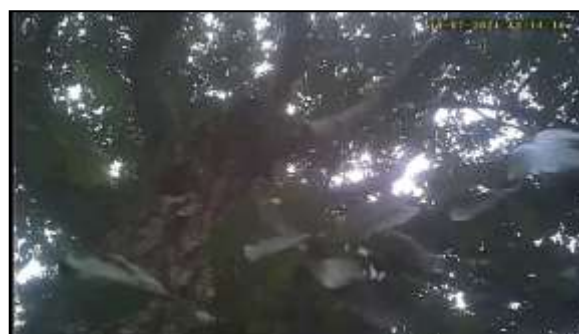
Figuur 11. Boomcamera gebruikt tijdens tweede veldbezoek om boomholtes nader te inspecteren.

De aanwezige bomen op de onderzoekslocatie zijn onderzocht op holtes, spleten en/of loshangend schors, die kunnen dienen als potentiële vaste rust- of voortplantingsplaats voor boombewonende vleermuizen. In verscheidene bomen zijn holtes aangetroffen. Deze holtes zijn onderzocht met behulp van een camera. De holtes waren te klein en niet hoog genoeg om als vaste rust- of voortplantingsplaatsen voor boombewonende vleermuizen te kunnen dienen. Daarmee zijn verblijfplaatsen van boombewonende vleermuizen uit te sluiten.