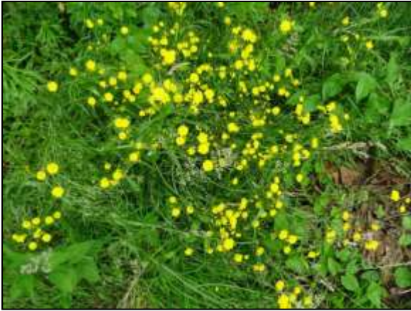
Figuur 12. Vegetatie met algemene soorten zoals muizenoor.