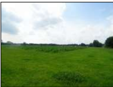
Figuur 6. De onderzoekslocatie vanaf de noordelijke zijde.