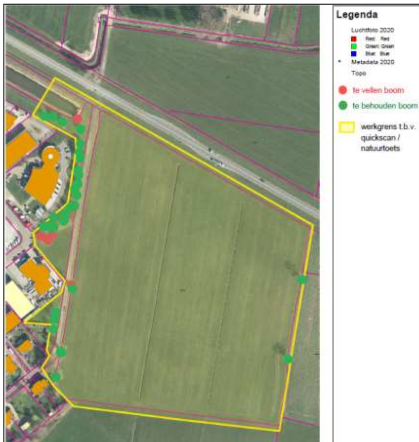
Figuur 10. Overzicht van de te kappen bomen. Van boven naar beneden zijn dat 4 zomereiken en 1 zwarte els.