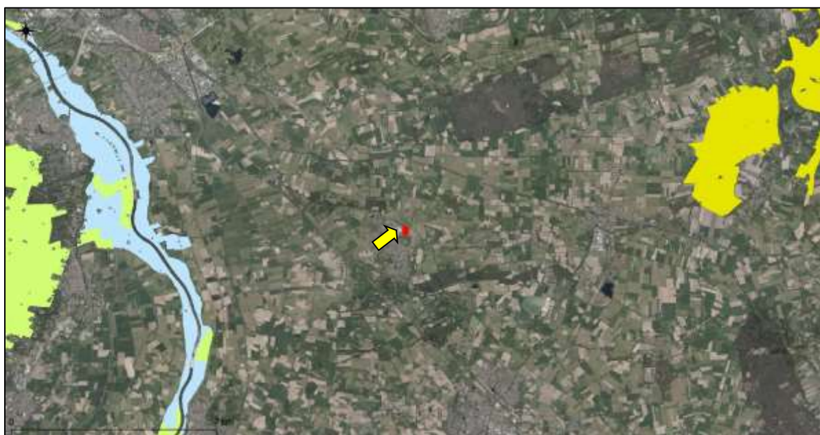
Figuur 14. Ligging onderzoekslocatie ten opzichte van Natura 2000.

De onderzoekslocatie is niet gelegen binnen de grenzen, of in de directe nabijheid van een gebied dat aangewezen is als Natura 2000. Het meest nabijgelegen Natura 2000-gebied, Rijntakken, bevindt zich op circa 7,1 kilometer afstand ten westen van de onderzoekslocatie. Daarnaast ligt op circa 9,2 kilometer afstand ten noordoosten van de onderzoekslocatie het Natura 2000-gebied Vecht- en Beneden-Reggegebied (zie figuur 14).