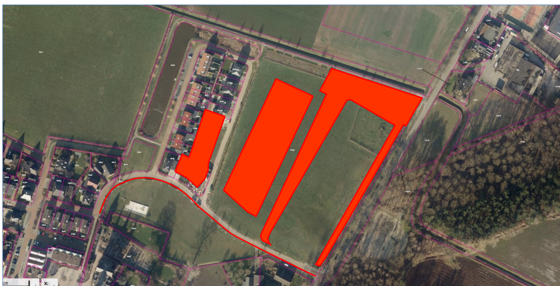
Figuur 3: luchtfoto bestaande situatie met indicatie plangebied.

Dit is weergegeven op onderstaande figuur 3 met de roodomlijnde gebieden. Verder blijkt Pereland breder aan de zuidzijde aangelegd dan op de verbeelding is aangegeven, ook dit wordt aangepast.