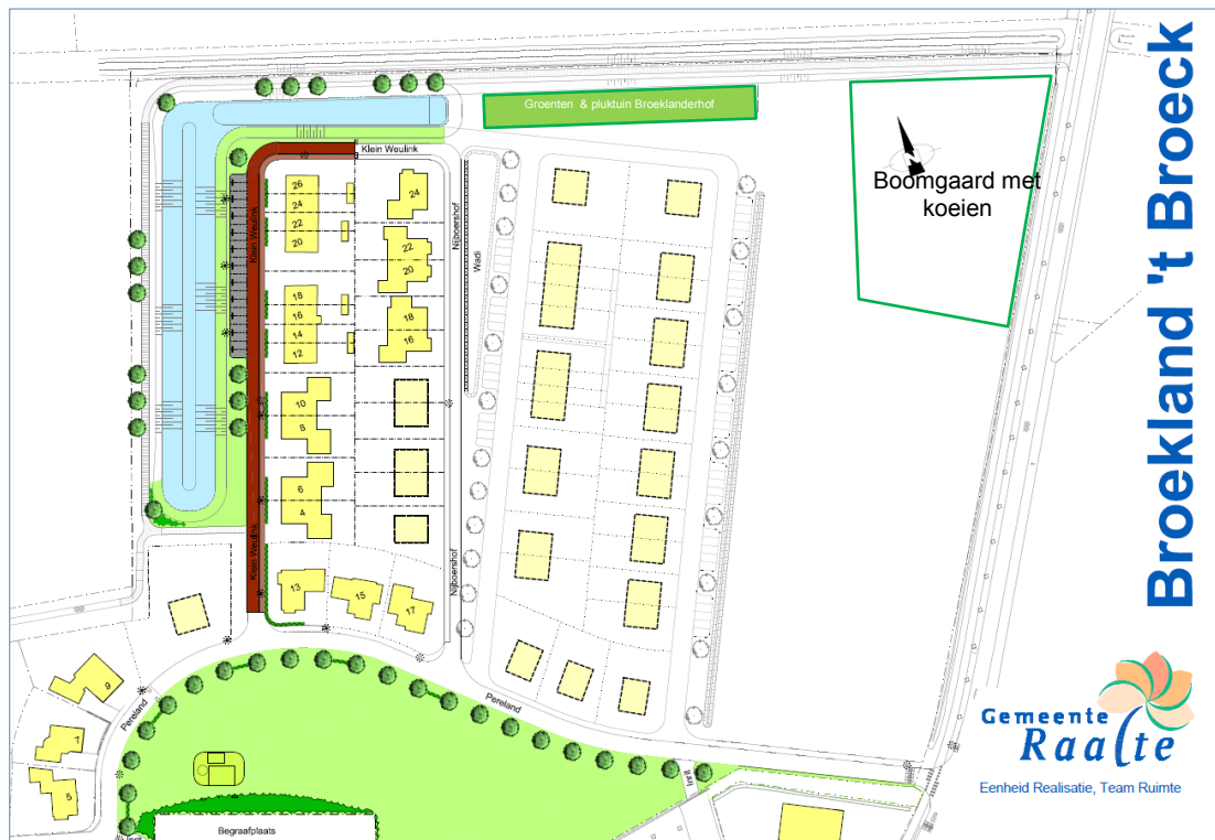
Figuur 5: Verkavelingsplan fase 2 (woningen met huisnummer zijn gerealiseerd d.d. 01-09-2018)

Op figuur 5 is het nieuwe verkavelingsplan weergegeven. Net als in fase 1 is de verkaveling in fase 2 flexibel, maar daardoor bestaat de kans dat de verkaveling niet meer in het bestemmingsplan past en kan uiteindelijk ook leiden tot een ander typeverdeling. De kans op eenzelfde problematiek als fase 1 en dat er onrendabele kavels overblijven bestaat ook. In beide bouwstroken moet daarom meer flexibiliteit mogelijk zijn.