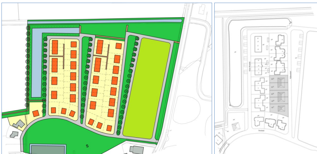
Figuur 1: Inrichtingsplan na afboeking veld 3 (links oorspronkelijke verkaveling veld 1 en 2; rechts gerealiseerde en nieuwe verkaveling rest veld 1)

In fase 2 moeten op de onverkochte kavels twee 2-1-kapwoningen en één vrijstaande woning gerealiseerd kunnen worden (zie figuur 1, rechts ) omdat er geen ruimte meer is voor 3 blokken van 2-1-kap. Aan Pereland zijn alleen vrijstaande woningen wenselijk en gerealiseerd (zie figuur 1, rechts ). Planologisch is echter alleen een vrijstaande en een 2-1-kapwoning toegestaan.