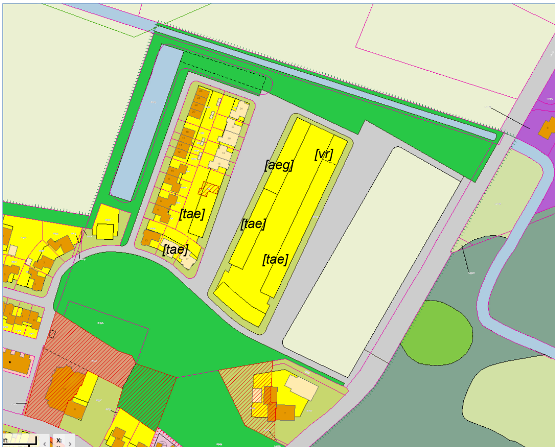
Figuur 4: Geldend bestemmingsplan Broekland met huidige stand van zaken verkaveling en verkopen

De toegestane bouwhoogten zijn: goothoogte van 3,5–6,5 m, bouwhoogte van 10 m.